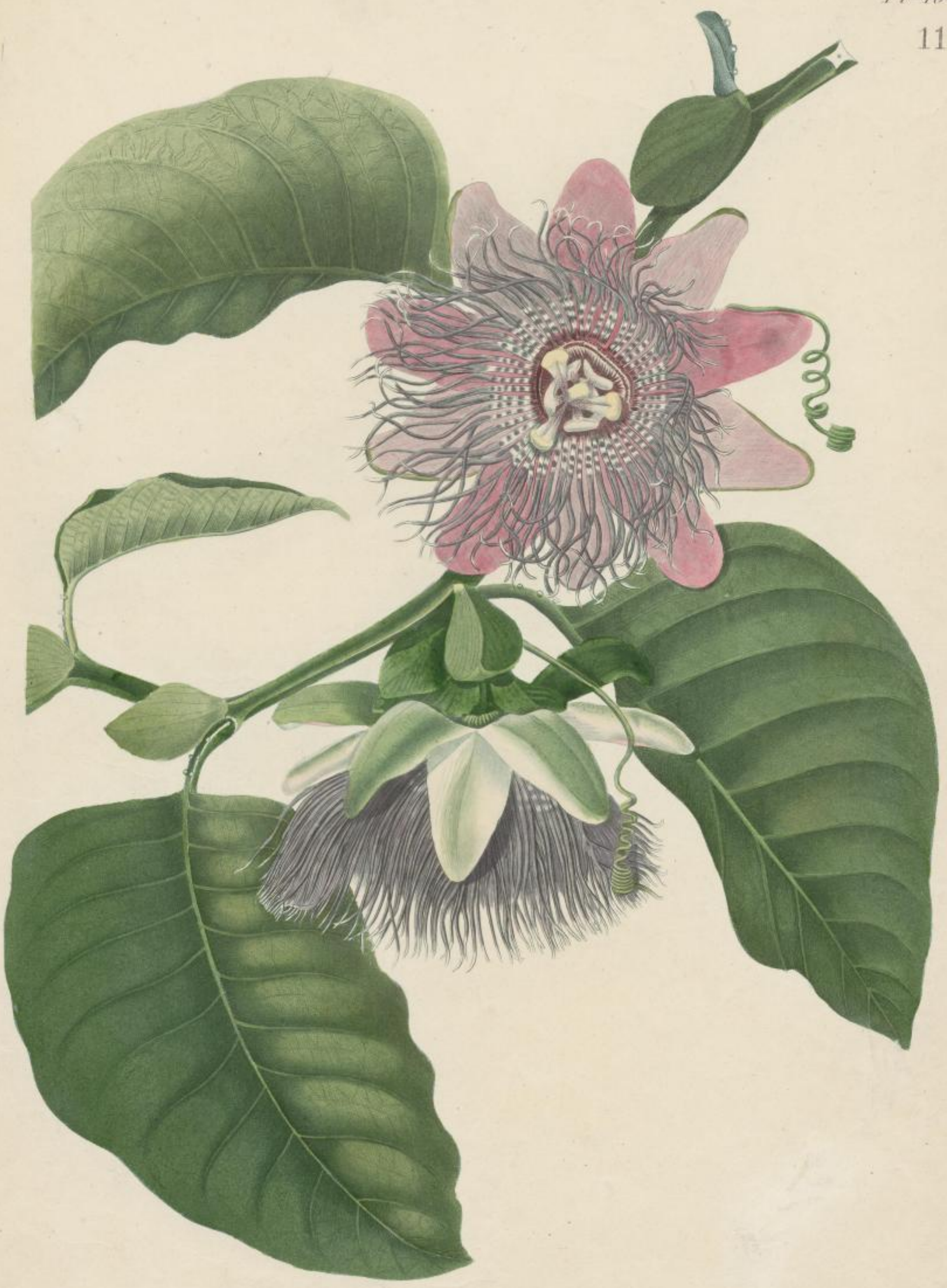
Passiflora quadrangularis. Grenadille quadrangulaire.