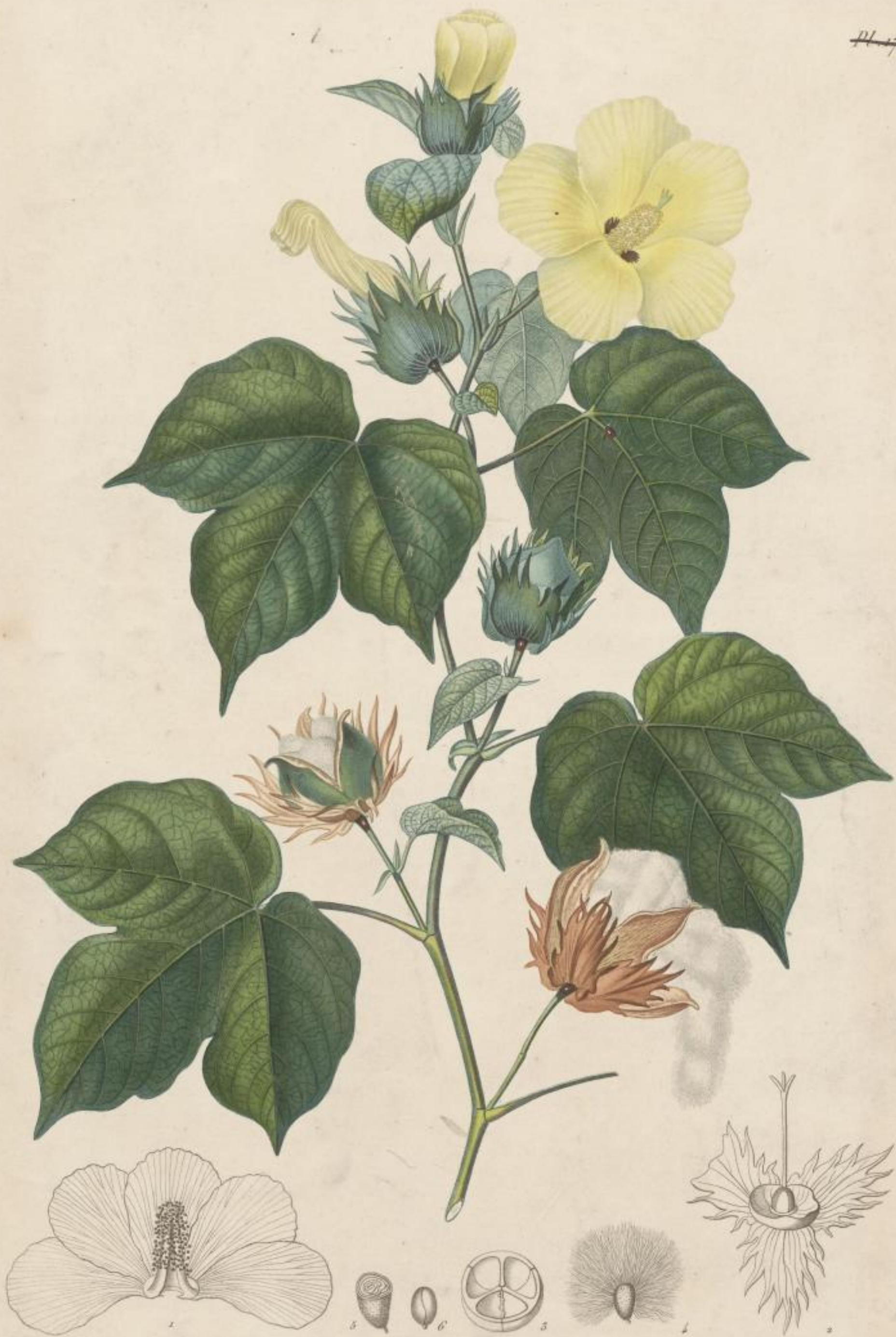
Gossypium trilobatum. (Linn.) G. religiosum. (Linn.) Cotonnier à trois pointes.