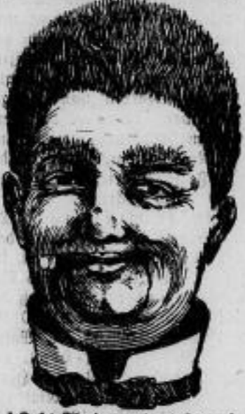
Carl Theodor nach 14 Tagen

Ein wertvoller Artikel für Expositoren: hoher Robott für Wiedererwerb. Diese Figur, ein Meisterstück der Keramik, ist aus feinstem rotem Terrakotta angefertigt und zeigt auf Kopf und Krone. In der Schilde sind blonde Wellen angebracht. In die Ritzen ist man Agrostisgras und füllt darauf den Kopf mit Wasser. Der Kopf ist hoch und hat oben eine Öffnung. Das Agrostisgras beginnt nun den Allern zu wachsen, und in kurzer Zeit ist der Kopf mit Gras bedeckt, welches nach und nach dunkler und von Tag zu Tag dicker wird. Carl Theodor hat eine Waage, auch aus dieser Waage treten lange Wurzeln. Der Kopf wird hineingestellt in den Krone, der den Unter-Tag bildet, welcher das herauswachsende Wasser aufnimmt; somit ist jede Verunstaltung ausgeschlossen, dort, wo Carl Theodor steht. Die ganze Figur, Kopf mit Krone, Unterfuß und 1 Boden 98 Pf. 3 dieser Figuren mit Zubehör 290 5 Figuren mit Zubehör 480 Unter 2 Figuren werden nicht abgegeben. Blumenwiebeln für das Zimmer: 1 Musterfortiment, enthaltend Hyazinthen, Tulpen, Tagelilien, Margeriten, Seilla, Crocus, schwarze Galla, jede Sorte getrennt und mit Kulturanleitung zusammen 50 Blumenwiebeln R. 1.85 zusammen 100 Blumenwiebeln R. 2.90 10 bezauberte, schöne, haltbare Hyazinthenblätter und 10 echte Quartier Hyazinthenwiebeln, zusammen R. 390 H. Petersen's Blumen- gärtnererei, Kollatoranten, Leipzig. Gratis u. franco verlange man Katalog über Chibdume, Rosen, Blumen u. Samen-Samen, Blumenwiebeln.