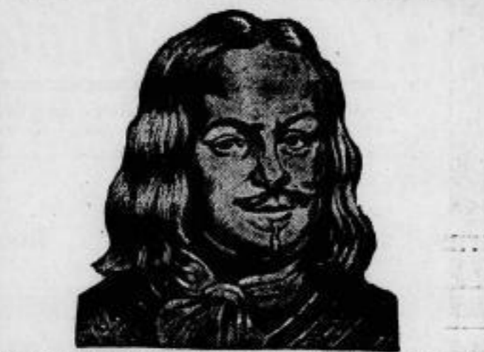
Zum 250. Todestag des berühmten holländischen Admirals de Ruyter. Am 20. April starb vor 250 Jahren Michiel Adriaanszoon de Ruyter, der vom einfachen Matrosen zum Admiral aufstieg, und dem die Holländer viele ihrer Seesiege über Engländer und Franzosen verdanken.