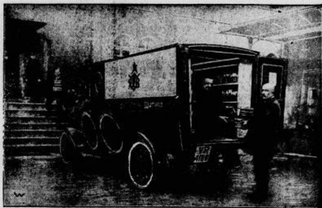
Die erste deutsche fahrbare Bibliothek. Die Stadtbibliothek in Worms hat als erste deutsche Bibliothek einen regelmäßigen Ueberlanddienst zur Bucherverforgung der Landorte eingerichtet. Mit Hilfe eines eigenen Bücherkraftwagens werden diese Ortschaften allwöchentlich mit allen bestellten Büchern unterhalten und wissenschaftlicher Literatur versehen. Kleine örtliche Depots ermöglichen auch einen Bücherwechsel zwischen den Autorandfahrten.