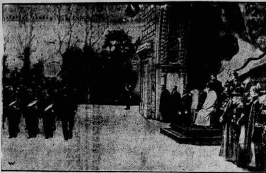
Das Fest der Palastgarde im Vatikan. S. H. Papst Pius XI. nimmt in den Gärten des Vatikans die Parade der Palastgarde ab. Die Palastgarde ist eine von den Bürgern Roms gebildete Ehrengarde des Papstes.