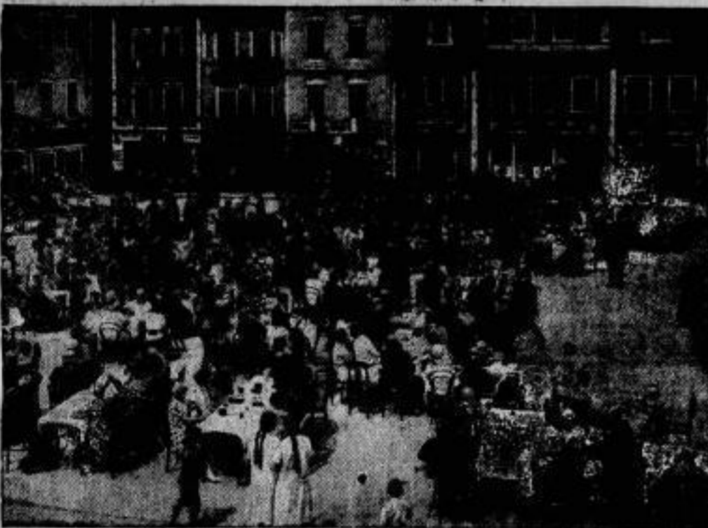
Ein Frühshoppen auf dem Marktplatz.

Auf der kürzlich stattgefundenen Rhein-Segelwoche erfolgte von dem Ziel Duisburg aus eine Schlepffahrt der geschicktesten Boote nach dem Städtchen Orsoy am Niederrhein.