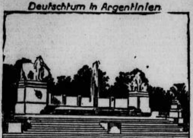
Der Monumentalbrunnen, der der Republik Argentinien von den Deutschen der Stadt Buenos Aires gestiftet wurde.

Argentinien, das von dem Jahre 1888 bis zum Jahre 1914 eine Bevölkerungszunahme von 2,5 Millionen auf 10 Millionen zu verzeichnen hat, ist zweifellos das am stärksten wachsende Land der Zukunft.