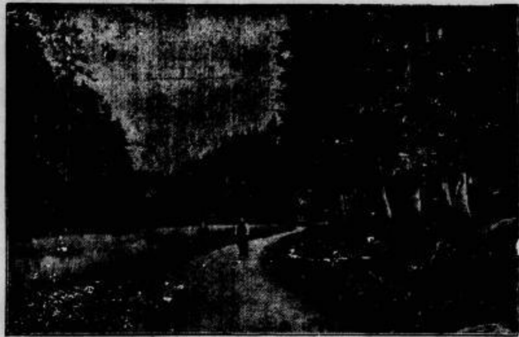
Die Stätte des Reichschrennmales.

Heimatfest in Gagnau. In Gagnau in Schlesien wurde vom 10. — 13. Juli ein Fest gefeiert, zu dem alle ehemaligen Gagnauer eingeladen waren. Aus ganz Deutschland kamen die Gäste und trafen sich zu einem Wiedersehen in der Heimat. Am letzten Tage dieses der Heimatliebe dienenden Festes fand ein origineller Frühshoppen auf dem Marktplatz statt.