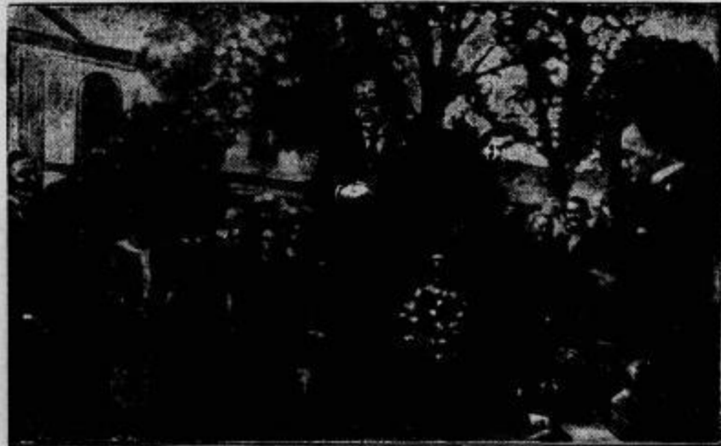
Rheinlandreise des Reichskanzlers Dr. Marx.

Das moderne Mädchen braucht keine Badekappe mehr wie die früheren Generationen, denn das nach Herrenart kurzgeschchnittene Haar trocknet sehr schnell.