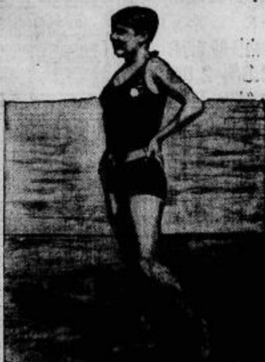
Die Badenige aus dem Jahre 1906.

Der Reichsratsauschuss für ein Reichschrennmal hat das Berg- und Waldgelände bei Verla a. d. Elbe als Reichschrennmal und als Stätte für das Schrennmal ausgewählt. Dieses im Herzen Deutschlands liegende Waldgebiet bildet ein nach allen Seiten vollkommen abgeschlossenes Dreieck, dessen Schenkellängen etwa 6 km betragen. Es ist vollkommen unberührt von Verkehr und Industrie und kann daher eine Stätte weisevoller Sammlung sein.