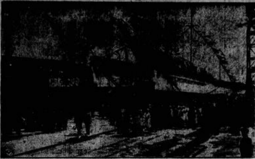
Stabellaufl deutscher Torpedoboots.