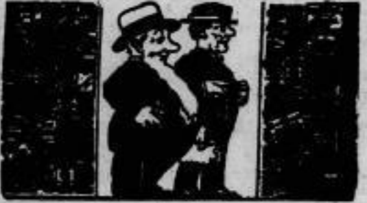
Wenn die Leser die Inserate durchsehen, sollte das Ihrige dabei sein. Denn: „unbekannt — unverlangt.“