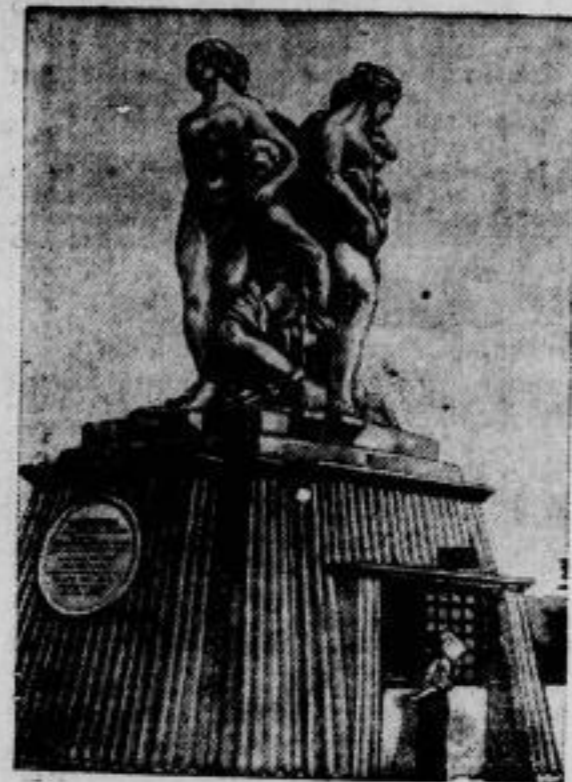
Ein Monument als Tabaktrafik.

Bei Burton in England findet gegenwärtig eine große internationale 8 Tage-Fahrt für Motorräder statt, an der auch 8 deutsche Fahrer teilnehmen. Das Rennen ist äußerst schwierig, da das Gelände sehr bergig und durch häufigen Regen aufgeweicht ist.