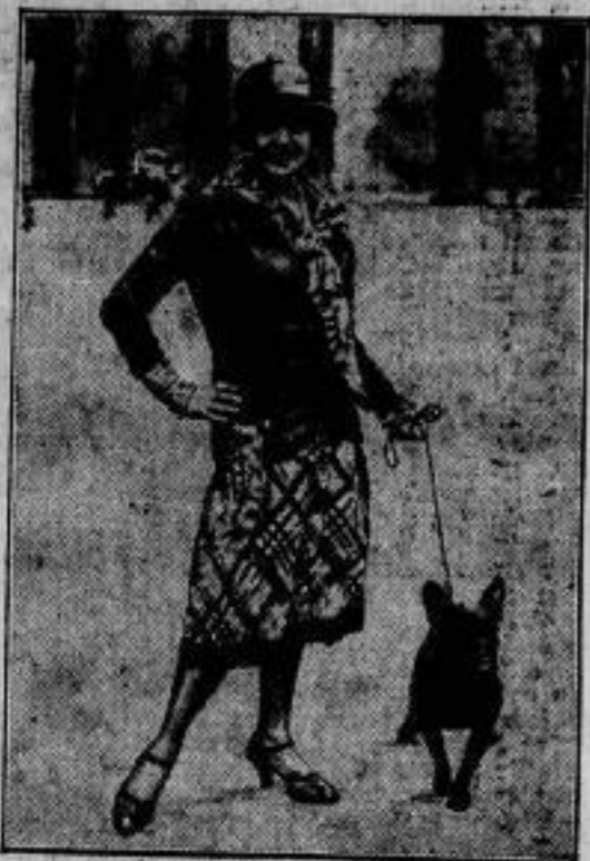
Mlle. Mittinguet in Berlin. Die bekannte Pariser Revue-Mäntlerin Mittinguet ist mit ihrem Sekretär und ihrer Hofe in Berlin eingetroffen und will hier 8 Tage ihrer Ferien verleben, um wahrscheinlich später in der Salzerrevue aufzutreten.