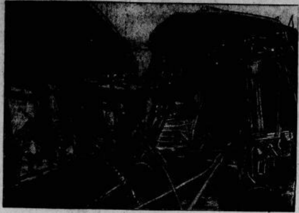
Die beiden ineinander geschobenen Wagen.