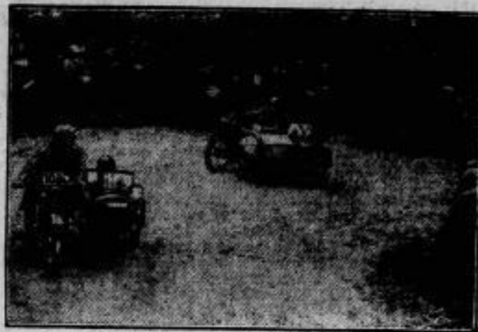
4 Tage-Fahrt der Motorräder. Seitenwagen in einer Kurve.

Bei Burton in England findet gegenwärtig eine große internationale 8 Tage-Fahrt für Motorräder statt, an der auch 8 deutsche Fahrer teilnehmen. Das Rennen ist äußerst schwierig, da das Gelände sehr bergig und durch häufigen Regen aufgeweicht ist.