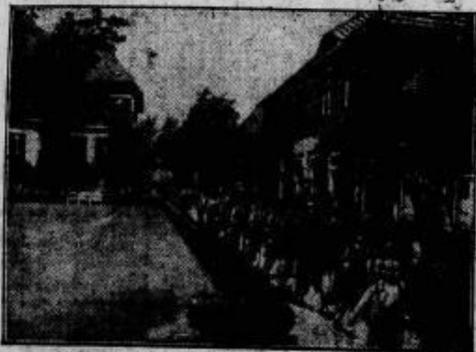
Ausmarsch der Böglinge zur Feldarbeit.

In dem Sockel eines Monuments auf dem Brager Brückenkopf befindet sich merkwürdigerweise eine Tabakverkaufsstelle verbunden mit Zeitungsverkauf. Dadurch die Wirkung der schönen, vom Bildhauer Stursa geschaffenen Gruppe erhöht wird, kann man allerdings nicht gerade behaupten.