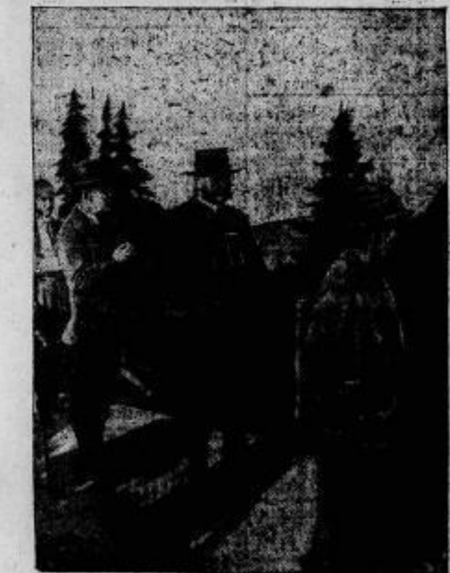
Der Reichspräsident im Urlaub. Reichspräsident v. Hindenburg in den Bayerischen Alpen.

Anstelle der Pferde als Zugkraft, ist jetzt die tschechische schwere Artillerie mit Traktoren versehen worden, was nicht nur eine Beschleunigung des Vormarsches, sondern auch eine Ersparnis an Material ermöglicht.