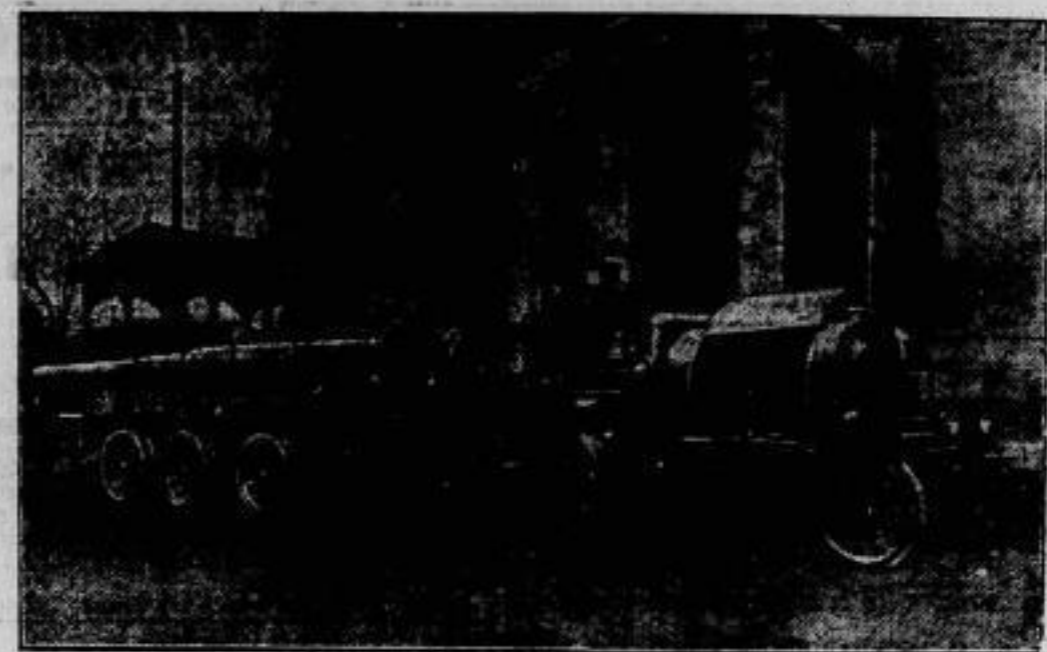
Die Motorisierung der Artillerie.

Amerika ist lange vor Columbus um das Jahr 1000 über Island und Grönland von den kühnen Seefahrern Norwegens entdeckt worden, nur daß die Kunde davon wieder verloren gegangen war. Jetzt hat Kapitän Folgero in einer den Wikinger-Schiffen nachgebildeten Barke von Bergen aus die Fahrt gewagt und auf demselben Wege Boston erreicht.