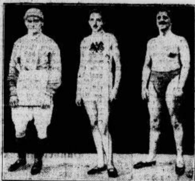
Drei deutsche Meister. Das „Goldene Band“