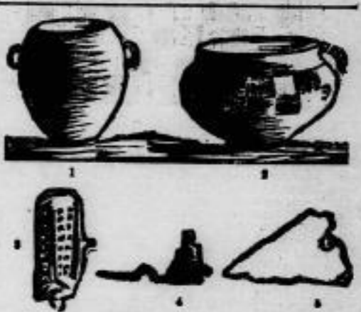
Abb. 2. Germanische Urnen und Scherdeln. Nr. 1 und 2 Urnen, Nr. 3 Gefäßgefäß, Nr. 4 Tonzubehälter, Nr. 5 Scherdel, Nr. 1 und 2 = 1/2 nat. Gr., Nr. 3 und 4 nat. Gr., Nr. 5 = 1/2 nat. Gr.

Am gleichen Tage wurden noch drei Hauptstellen entdeckt, die 1,5 Meter südlich eine zweite Reihe bildeten. Die Urnen sind in der Regel aus einem anderen Ton geformt ist, und einem Fuß, der in der Regel aus einem anderen Ton geformt ist. Die Urnen sind in der Regel aus einem anderen Ton geformt ist, und einem Fuß, der in der Regel aus einem anderen Ton geformt ist. Die Urnen sind in der Regel aus einem anderen Ton geformt ist, und einem Fuß, der in der Regel aus einem anderen Ton geformt ist.