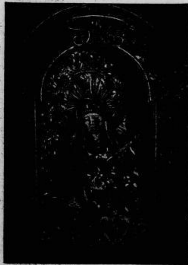
Ein kostbarer Fund im heiligen Land. Das wundervolle Mutter-Gottes-Bild wurde in der Christuskirche von Galatas in Jerusalem kürzlich entdeckt. Es ist aber und aber mit kostbaren Steinen und Ornamenten bedeckt.