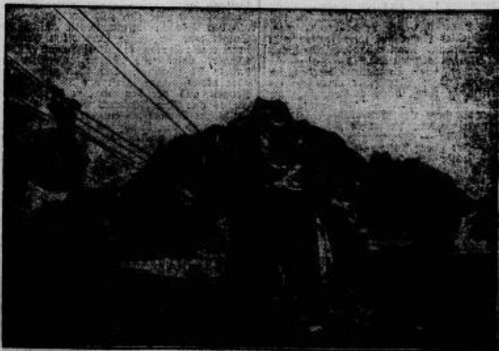
Neuschnee-Schneefelder eröffnet. In Clementy fand in Anwesenheit des Wirters der schneefelder Arbeit, Lathen, die Einweihung der Schneefelder nach dem Romantikzeit, deren Bauzeit nicht weniger als sechs Jahre gedauert hat. Die Substanz liegt in einer Höhe von 1004 Metern. Der Bogen, der 18 Personen hoch, ermöglicht auf der Tal, wie auf der Bergfahrt eine Geschwindigkeit von 150 Metern pro Minute.