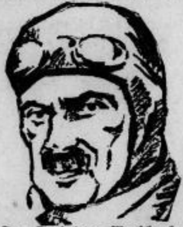
Der „Lauder von Warschau“. General Jagoraki. Die polnische Öffentlichkeit befindet sich in heftigster Erregung über das mysteriöse Verschwinden des Generals Jagoraki, der bei dem Staatsstreich Marschall Pilsudskis im Mai vorigen Jahres die wito- treuen Truppen in Warschau kom- mandierte und seither in Wilna im Gefängnis saß.