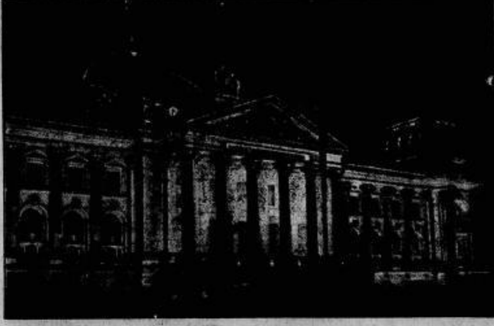
Beleuchtung des Reichstagsgebäudes am Abend des Verfassungstages. Anlässlich des Verfassungstages wurde das Reichstagsgebäude durch Scheinwerfer beleuchtet.