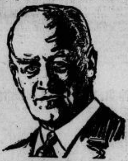
In Goldworth 60. Geburtstag. Der bekannte englische Schriftsteller John Galsworthy, dessen gesell- schaftskritische Romane auch in Deutschland viel gelesen werden, feiert am 14. August seinen 60. Geburtstag.