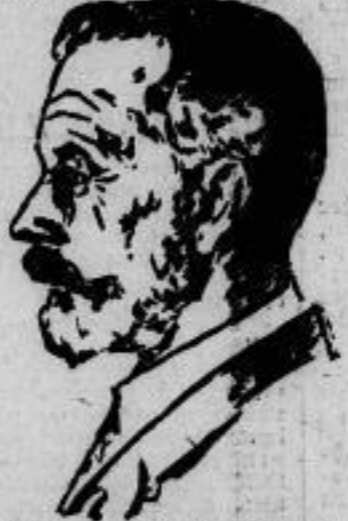
Prinz Heinrich von Preußen 65 Jahre alt. Prinz Heinrich von Preußen, zweiter Sohn Kaiser Friedrichs III., wird am 14. August 65 Jahre alt. Prinz Heinrich war während des Welt- krieges Oberbefehlshaber der Streit- kräfte in der Ostsee.