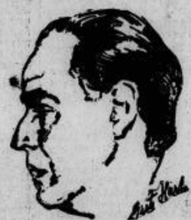
Der Dichter Ebschmidt preisgekrönt Der belgische Staatspreis für Lite- ratur (Georg-Bühner-Preis), der am Verfassungstage verliehen wird, wurde von dem Staatspräsidenten dem Dichter Kasimir Ebschmidt zu- gespröchen.