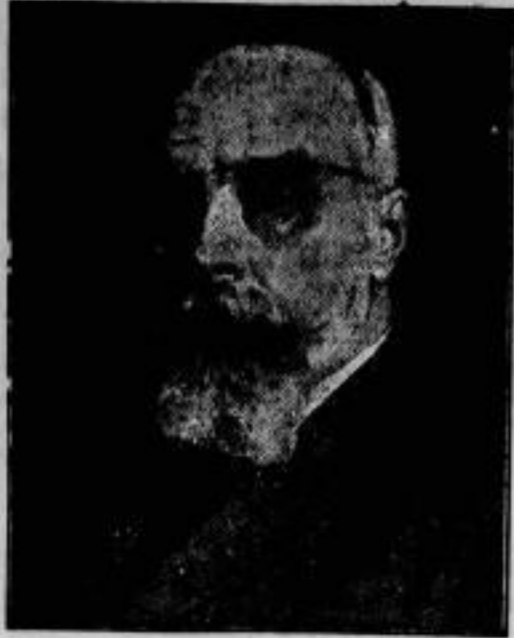
Bild-Telegraphie Wien-Berlin eröffnet.