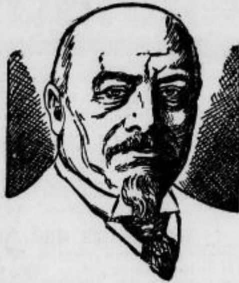
Frankreichs neuer Delegierter zur Völkerbundversammlung, Senator Lucien Duberq.

Von ihr schreibt der Kunsthistoriker Dehio in seiner großen Kunstgeschichte: „Die Renaissance-Treie heben im Ornament in englischer Färbung mit Oberkanten, ohne doch gotische Reminiszenzen völlig abzuweisen. Das ganze Architekturgebilde ist eine der glücklichsten Leistungen des 16. Jahrhunderts durch die Originalität und Frische, womit die der deutschen Renaissance besonders angemessene asymmetrische Kompositionsweise durchgeführt ist, in geistreicher Deutung und Nutzung des Zufälligen.“