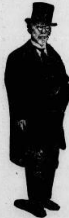
Japan will engere Beziehungen mit Deutschland und Rußland anknüpfen. Viscount Goto, der soeben mit der Sowjet-Regierung über die Gewährung ausgedehnter Landkonzessionen in Ostibirien zum Zwecke des Eisenbaues verhandelte, Viscount Goto wird auch nach Berlin kommen und versuchen, engere Beziehungen zwischen Japan und Deutschland anzuknüpfen.