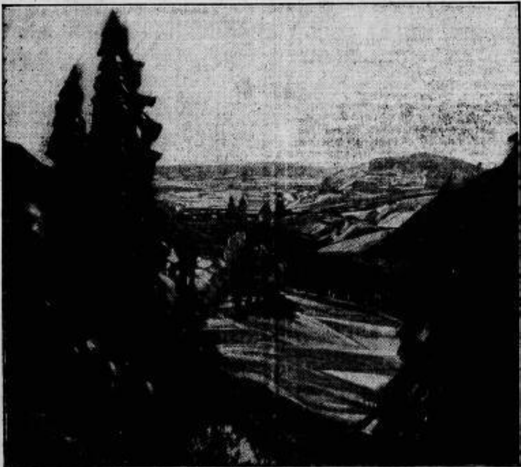
Die Frage des Reichschreinalts. Die Entscheidung, wohin das Reichschreinalt kommen wird, ist entgegen den letzten Hoffnungen noch nicht erfolgt, wird aber demnächst erwartet. Das hier veröffentlichte Bild, nach Gemälde des hannoverschen Malers Heinicke-Altenau, behandelt den Reichschreinalt vor der Stadt Goslar, die am Rande des Harzes einen prächtigen Wald für die Erholung der gefallenen Helden zur Verfügung gestellt hat. Der Mittelpunkt dieses Parks ist das riesige offene Felsenrund der seit 100 Jahren stützenden alten Vatschiefergrube. Ihre wuchtigen Felsenwände, von deren Höhe die dunklen Lannen herabgrünen, bilden eine Stätte naturgegebener Feierlichkeit und Abgeschlossenheit, gleichsam einen Felsenraum im deutschen Wald, darüber der weite Himmel sich als Riesenkuppel wölbt.