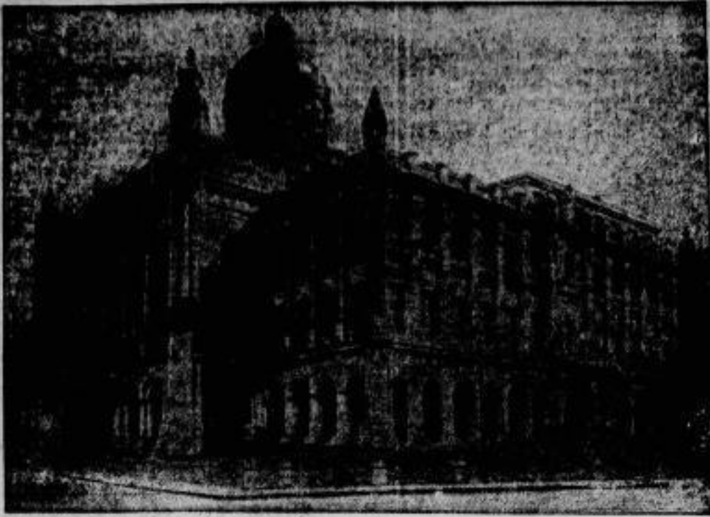
Wo der pan-amerikanische Kongress tagen wird. Der pan-amerikanische Kongress wird Ende Januar im Präsidenten-Palast in Habana auf Cuba tagen. Auf diesem Kongress werden alle nord- und südamerikanischen Staaten vertreten sein, die Vereinigten Staaten durch Coolidge.