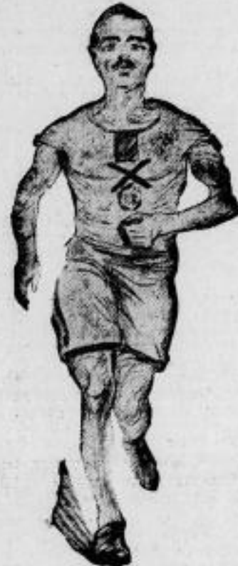
Ein neuer Weltrekord über 100 Kilometer. Newton. Der bekannte südafrikanische Langstreckenläufer Arthur Newton unterbot den seit dem Jahre 1882 bestehenden Weltrekord mit der neuen Weltrekordzeit von 14 Stunden 22 Minuten 30 Sekunden.