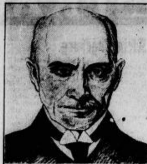
Der Verfasser des „Golem“ 60 Jahre alt. Gustav Meyrink.

Der Schriftsteller Gustav Meyrink, seit 1906 langjähriger Redakteur am „Simplicissimus“ und Verfasser der phantastischen Romane „Der Golem“ und „Das grüne Gesicht“, feiert am 19. Januar seinen 60. Geburtstag.