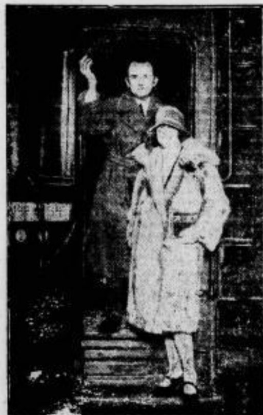
Ein letztes Lebensbild. Abreise des neuen Botschafters nach den Vereinigten Staaten. Botschafter von Pittman und Gaffron auf dem Lehrter Bahnhof in Berlin.

Welt- liegen. ehren- Junge n und el ber- torin", rauen, haben, haben, auch stitute schöne- tsdot- die erfähr- wie fährt, leinen, einer euzen, sehen, Vor- n der erum- von timin- und amen, d er- diesem werden den.