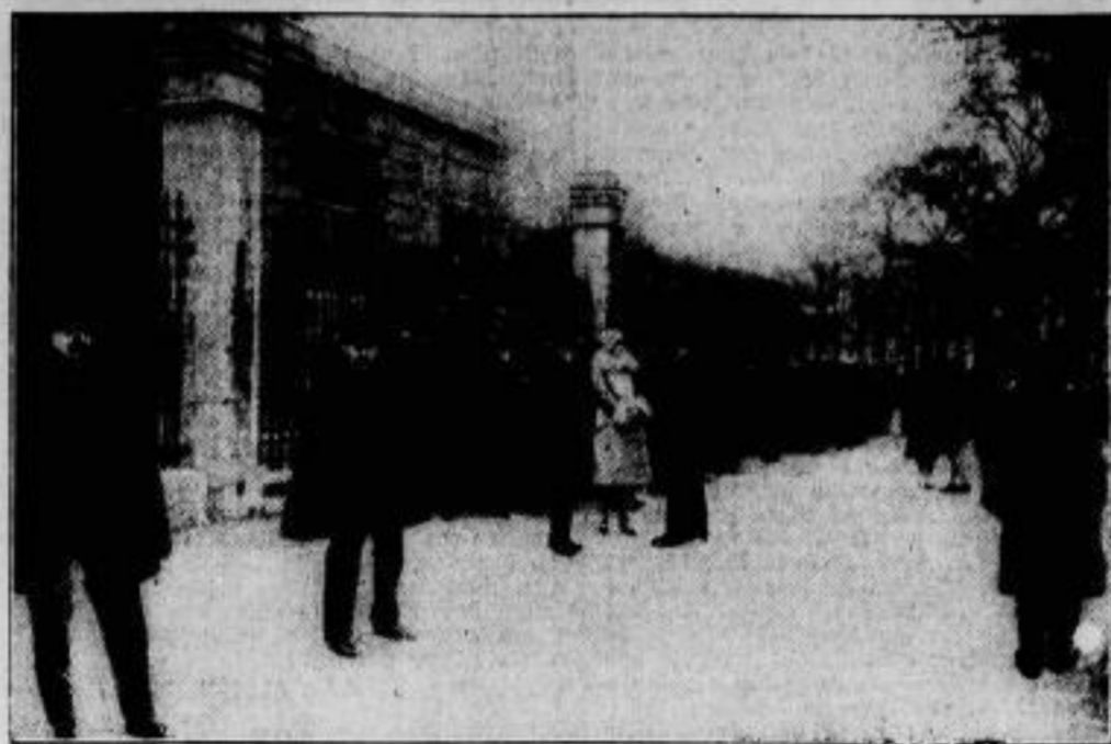
Die Eröffnung der französischen Kammer. Bemerkenswert ist die Menge Volkstufen am Vorort, die nach den Kommunisten schreit, gegen die ein Verbotsecht erlassen ist.