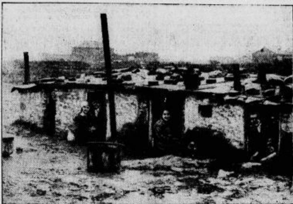
Wohnungsnot auch in Wien. In der Nähe Wiens haben sich einige Familien auf einem Schutt- und Ablagerungsplatz eine Erdhöhle primitiv überbaut und hausen nun in diesen Böhern.