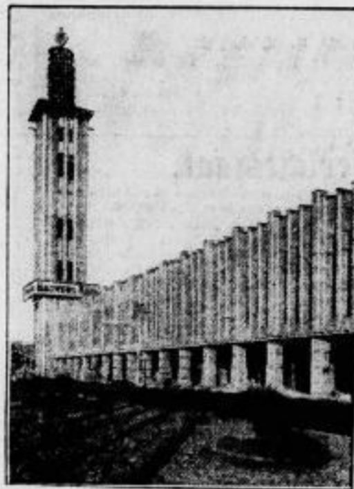
Der Prella entzogen.

Da der alte Ballotbau für unsere zahlreichen Volksvertreter viel zu klein geworden ist, muß ein Neubau vorgenommen werden, für den bis jetzt 288 Entwürfe eingegangen sind. Von den Arbeiten wurden drei mit dem zweiten Preis ausgezeichnet, ein erster Preis gelangte nicht zur Verteilung. Außerdem sind drei Entwürfe vom Reichstag angekauft worden.