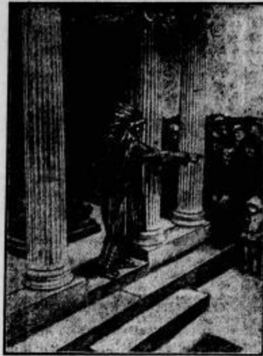
Indianer-Ehrung Carl Rasch.

Eine in Deutschland weilende Indianer-Abordnung aus Dogota (Amerika) legt am Grabe des berühmten deutschen Indianer-Schriftstellers Carl Rasch in Dresden zu Ehren des Verstorbenen einen Kranz nieder. Der Führer der Indianer-Abordnung, Big Snake, genannt „Die große Schlange“ hält die Gedenkreide.