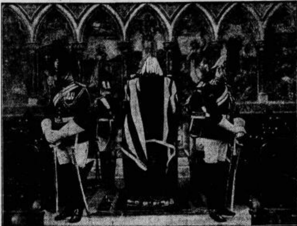
Die Ausföhrung Marshall Gais. Der in der Londoner St. Columba-Kirche aufgebahrte Körper des verstorbenen Feldmarschalls Gais, der englischer Oberbefehlshaber im Weltkrieg war. Die Ehrenwache wurde von der Kavallerie gestellt. Helm, Schwert und Stab des Marschalls blieben auf dem flaggenbedeckten Sarg.