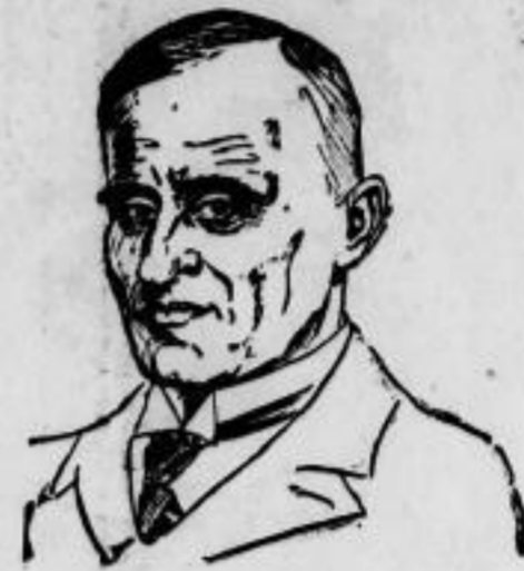
Der neue Präsident des Deutschen Landkreistages Landrat Frhr. v. Stempel wurde an Stelle des verstorbenen Landrats a. D. Constan- tin, durch einstimmigen Beschluß des Vorstandes, zum Prä- sidenten des Deutschen und Preussischen Land-Kreistages gewählt. Er lebt im 46. Lebensjahr und war zuletzt Land- rat der Kreise Wirsis und Kolberg.