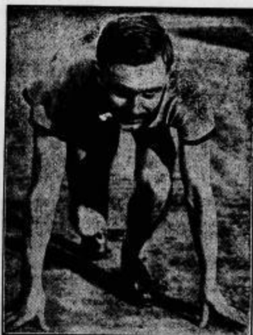
Erster Sieg Pelzer in Amerika. Nach langwierigen Verhandlungen fand end- lich in New York der erste Start des deutschen Meisterläufers Dr. Pelzer statt, der in einem 1000 Yards-Rennen einen sicheren Sieg errang.