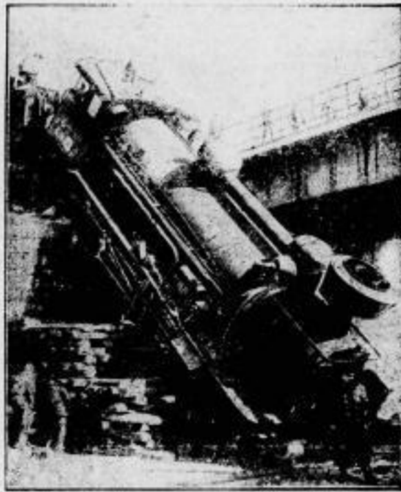
Schweres Eisenbahnunglück bei Wien. Die abgestürzte Lokomotive. Infolge falscher Weichenstellung führte in Oestrichthal bei Wien ein Zug in die Gurnoldbrücke hinab. Neun Bahn- beamte wurden schwer verletzt.