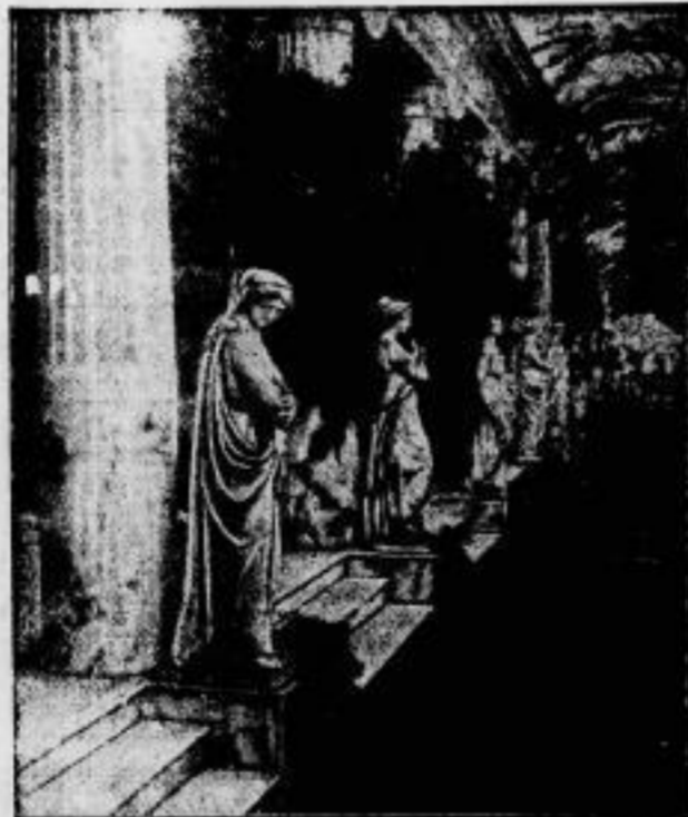
Griechenland kauft das Kalkedon. Der Wandelgang des Schlosses. Der griechische Minister für Volkswirtschaft hat dem Mini- sterrat einen Vorschlag unterbreitet, das Kalkedon auf Korsu für 28 Millionen Drachmen anzukaufen.