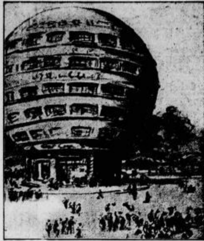
Das erste Kugelhaus der Welt. Eine sensationelle architektonische Idee. Das erste Kugelhaus der Welt wird nach dem Entwurf des Münchener Architekten Prof. Peter Birkenhofs auf der diesjährigen Ausstellung der Jahreschau Deutscher Arbeit in Dresden „Die Technische Stadt“ Dresden 1928 errichtet werden. Es wird eine Höhe von etwa 30 Meter, einen Durchmesser von 25 Meter auf einem Sockel von etwa fünf Meter haben. Die vier unteren Stockwerke werden Ge- schäftsflächen enthalten, der Oberteil unmittelbar unter der Kuppel ein Cafeteria mit dem Blick auf Dresden und eine Umgebung.