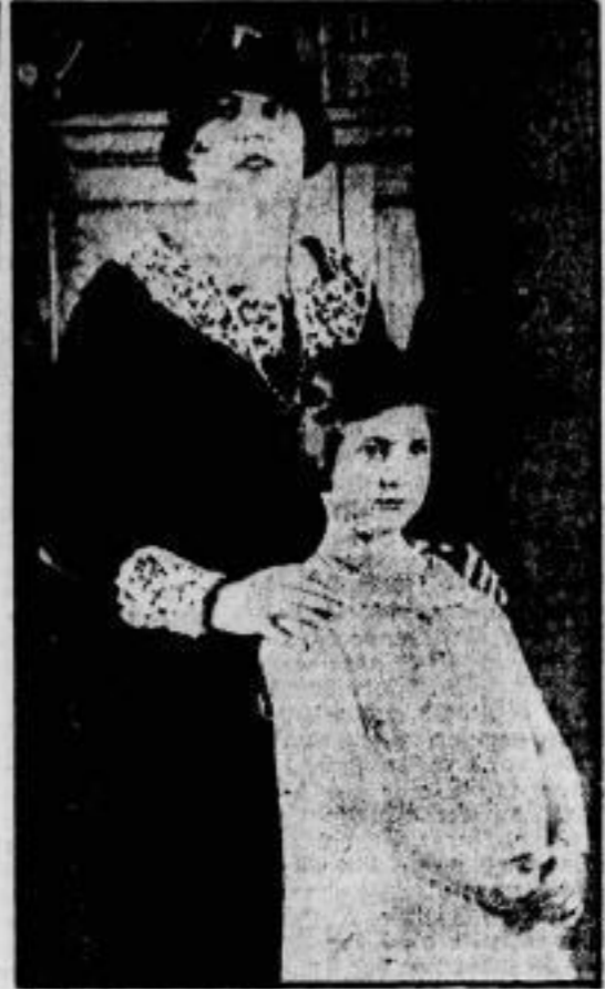
Carusos Töchterchen als Millionenerbin.