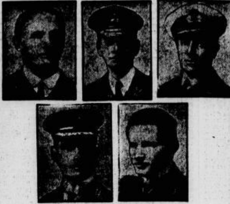
Die Köpfe der englischen Offiziersrevolte.