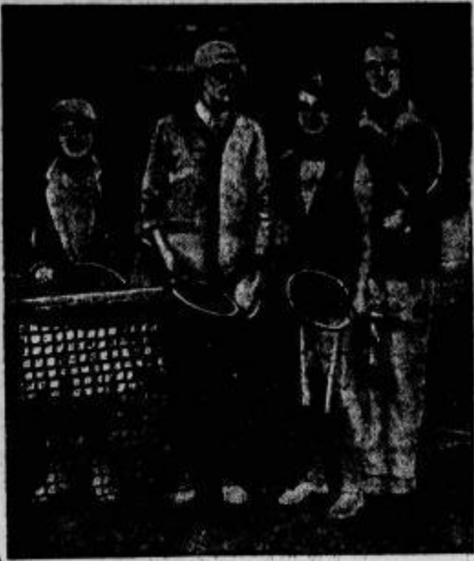
„Mr. G.“ und seine Partnerin.