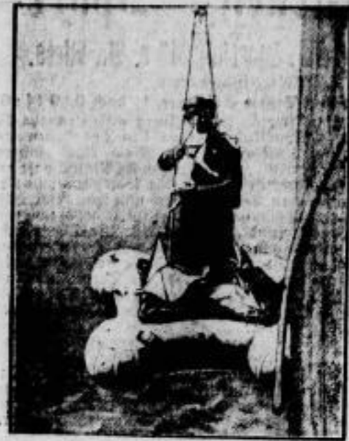
General Nobiles Fahrstuhl. Das Luftschiff „Italia“, mit dem General Nobile seinen Nordpolflug ausführen will, ist zu Sweden der Landung eines einzelnen Mannes auf dem Meere mit einem luftgefüllten Schwimmfloß ausgerüstet, das vom Luftschiff aus zur Meeresoberfläche hinuntergelassen werden kann. Bei dem 24stündigen Probelauf, den das Luftschiff kürzlich unternahm, wurde auch das Landen des Schwimmfloßes auf dem Meere erfolgreich ausprobiert. Im Bilde: Nobiles Hund, der seinen Herrn auch zum Nordpol begleiten wird, beteiligt sich an der Fahrt in die Tiefe.