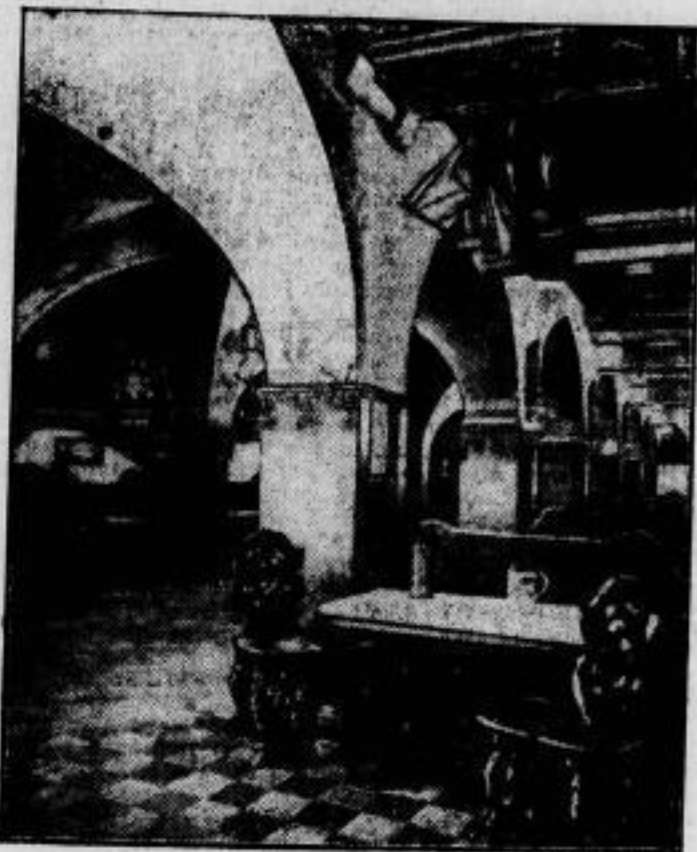
Ein musterhaftes Stadthotel. wurde von der Stadt Dortmund eingerichtet. Die vierzehn Zimmer des Hotels, die ebenfalls mit zusammenklappbaren Betten ausgestattet sind, zeigen eine Vereinigung von Wohn- und Schlafzimmern. Die dem Hotel angegliederte Stadtschenke (im Bilde) ist mit wertvollen antiken Möbeln aus Dortmunds Umgebung ausgestattet.