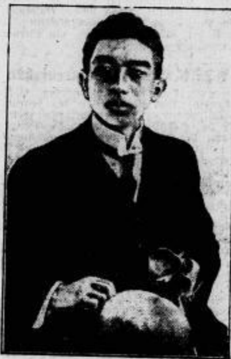
Ein Attentatsplan gegen den Mikado? Aus Tokio wird gemeldet, daß eine gegen den Kaiser von Japan gerichtete kommunistische Verschwörung aufgedeckt worden sei. Ueber tausend kommunistische Agitatoren sind verhaftet worden. — Unser Bild zeigt den Kaiser von Japan.