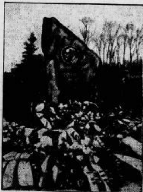
Ein Rennfahrer-Denkmal. Am Karfreitag wurde ein Denkmal, der für den im vergangenen Sommer tödlich verunglückten Rennfahrer Franz Krupat vor der Berliner Olympia-Radrennbahn errichtet wurde, in Gegenwart einer großen Sportgemeinde enthüllt.