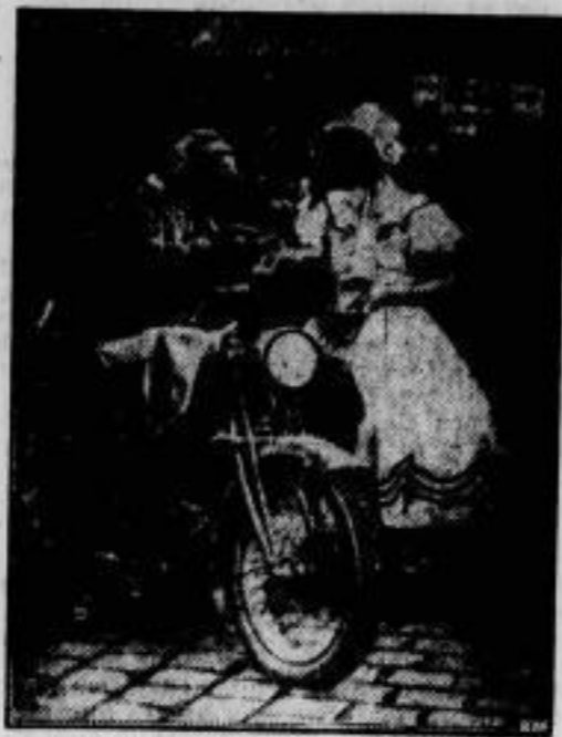
Die fünf Länder-Fahrt der Motorräder des U. D. K. C. führte von Köln durch Deutschland, Polen, die Tschechoslowakei, Oesterreich nach Budapest. Unser Bild zeigt die Ankunft eines Teilnehmers in Wien, wo er von einer jungen Dame in Alt-Wiener Tracht gelobt wird.