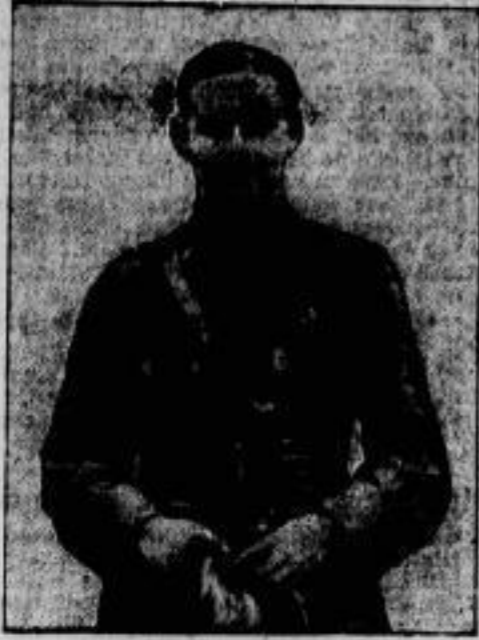
Fliegermajor Schwanitz als junger Offizier im Alter von 20 Jahren.