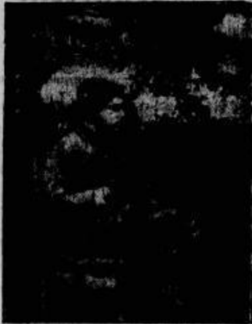
Leutnant von als junger Mensch in seiner bayerischen Heimat.