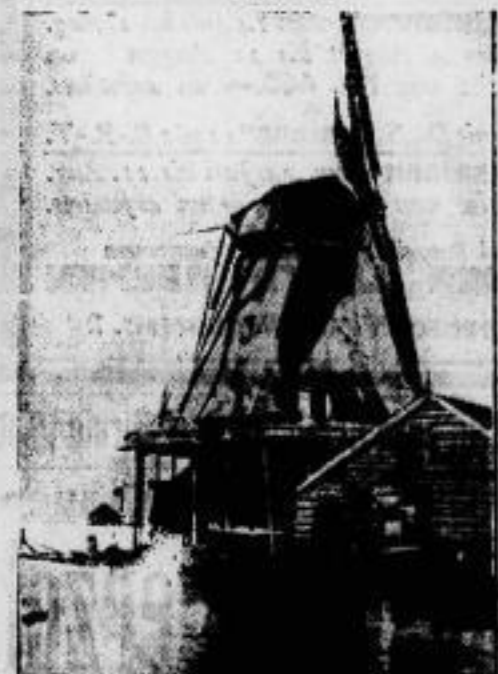
Die Mühle des Jaren-Zimmermanns abgebrannt. Die Sägemühle de Grootvork in Baandam in Holland, in der im Jahre 1697 Jaren Zetter der Große als Zimmermann gearbeitet hat, ist bis auf die Grundmauern niedergebrannt.