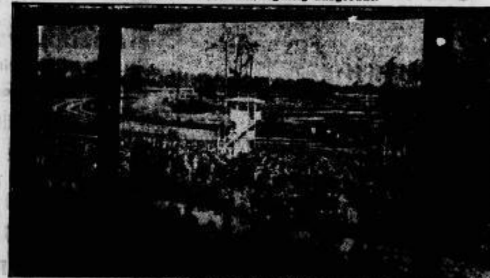
Beginn der Rennsaison. Das erste diesjährige Rennen auf der Grunewald-Rennbahn bei Berlin fand am 26. April statt. — Im Bilde: Blick auf Bahn und Geläuf während des Tarlatan-Gärtenrennens.