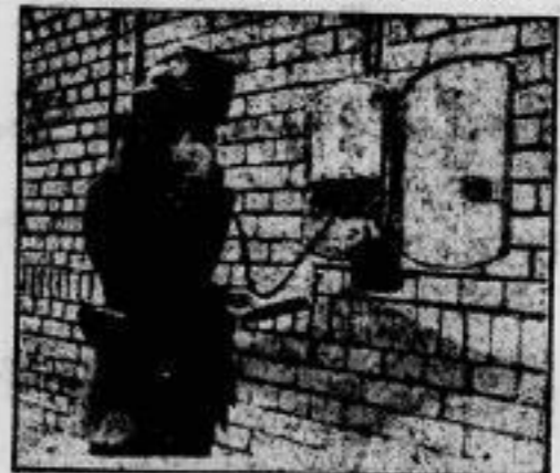
Das Alarmtelefon auf der Straße. In Berlin wurde eine Neuerung eingeführt, die zur Erhöhung der öffentlichen Sicherheit beitragen wird. Auf der Straße wurden — ähnlich wie Feuermelder — Alarmtelefone angebracht, durch welche das Ueberfallkommando der Polizei in kürzester Zeit herbeigerufen werden kann.