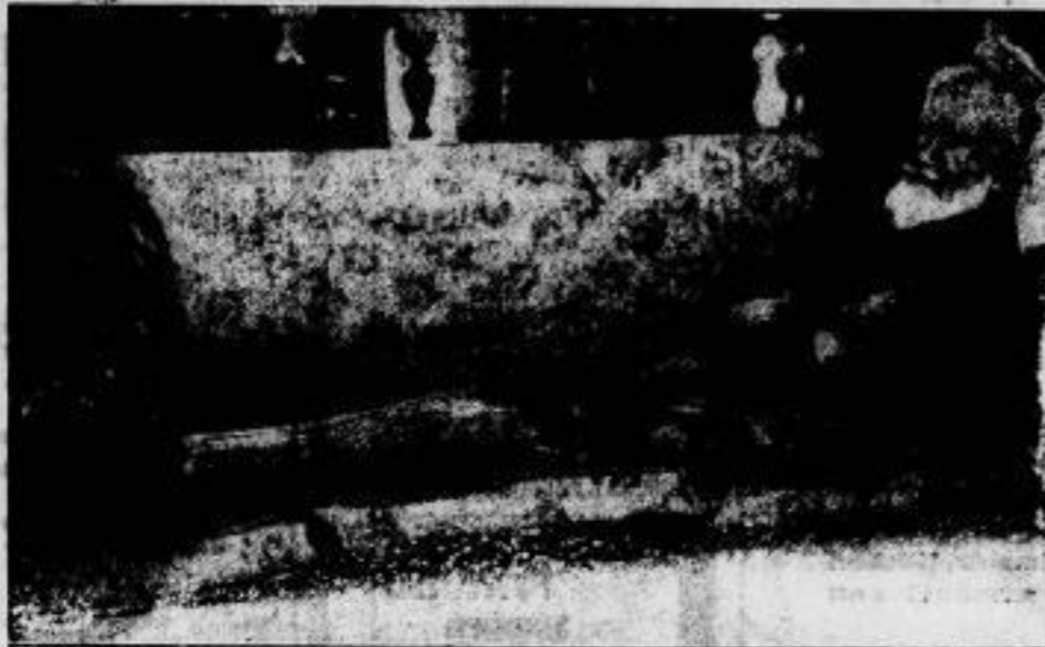
Bernhard Shaw , der erfolgreichste Schriftsteller und weitverbreitete Bühnendichter der Gegenwart, ist von seinem bisherigen Heim in Adelphi Terrace, London, nach Whitehall Court, London, übergesiedelt, wo — wie unser Bild zeigt — er sich recht behaglich eingerichtet hat.