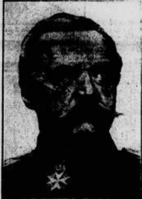
Roon 125. Geburtstag. Am 30. April vor 125 Jahren wurde Generalfeldmarschall Graf von Roon, dessen Name mit den Ruhmestaten des deutschen Heeres im Kriege 1870/71 untrennbar verbunden ist, in Meußbagen bei Kolberg (Pommern) geboren.