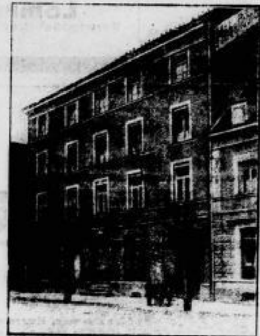
Die Wiege des Ruhmes. Das Geburtshaus des Ozeanfliegers Hauptmann Rühl in Regensburg (Bayern).