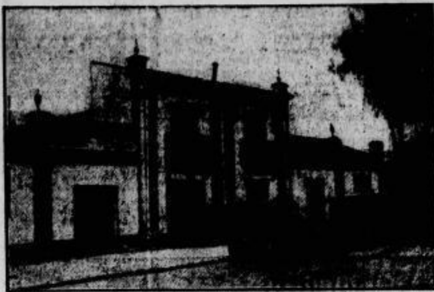
Carmen wird heimattlos. Die Schenke Britana in Seoul, die durch Carmen, die Hauptfigur in Bizets gleichnamiger Oper, Weltberühmtheit erlangt hat, soll jetzt abgerissen werden, um der großen Ibero-amerikanischen Ausstellung Platz zu machen.