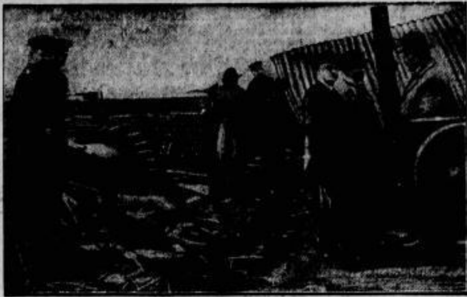
Die Giftdampf-Katastrophe in Hamburg. Die Unglücksstätte, von der aus die Phosgengaswolke sich verbreitete. Rechts ein durch die Explosion des Gastanks fortgeschleudertes Wellblechdach.