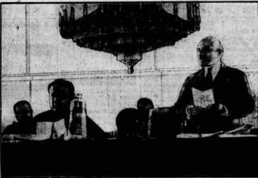
Vom Schachtel-Prozess in Moskau. Generalsstaatsanwalt Rykoff verliest die Anklageschrift.