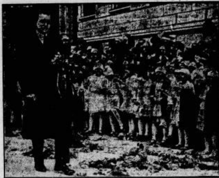
Ungarns Dank an Lord Rothermere. Lord Harmsworth, der Sohn des englischen Zeitungskönigs Lord Rothermere, wurde bei seinem Aufenthalt in Budapest von der ungarischen Regierung und Bevölkerung begeistert gefeiert, zum Dank dafür, daß sein Vater die Sache Ungarns durch Forderung einer Revision des Friedensvertrages von Trianon tatkräftig unterstützt hat. — Im Bilde: Schulkinder überschütten den Weg Lord Harmsworths, der das Budapest Rathaus verläßt, mit Blumen.