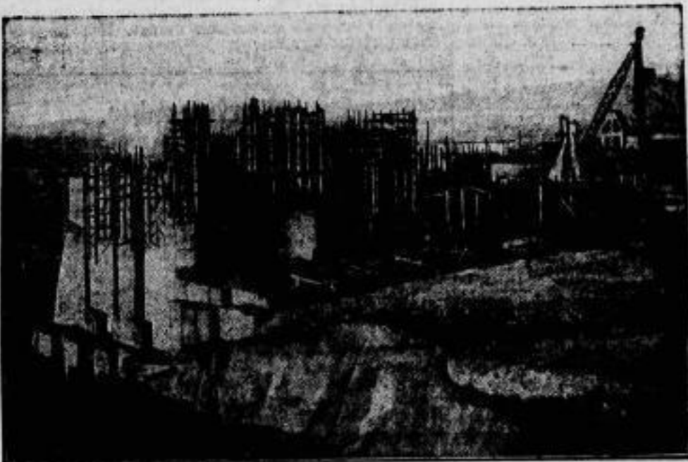
Deutscher Bau eines Riesenkraftwerkes in Irland. Die irische Regierung läßt durch eine deutsche Firma zur Ausnutzung der gewaltigen Wasserkräfte des Shannon ein riesiges Kraftwerk von 120.000 Pferdekraftleistung erbauen, das nach dreijähriger Bauzeit im nächsten Jahre fertiggestellt sein wird. — Im Bilde: der gegenwärtige Stand der Betonierungsarbeiten des Shannonkraftwerkes.