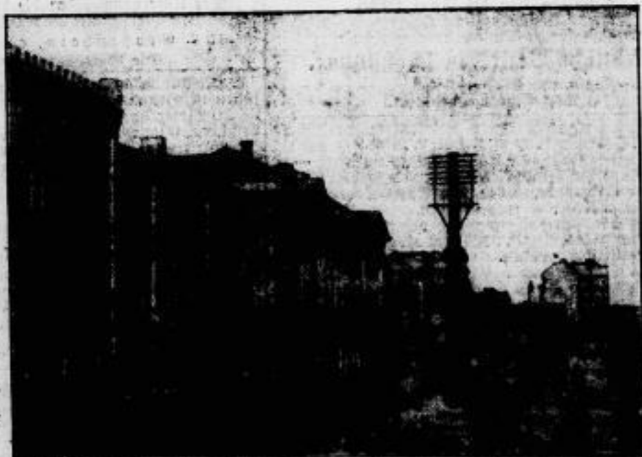
In den Karan in Belgrad. Die Belgrader Universität, von der die Demonstrationen der Studenten ausgingen. Das Universitätsgebäude wurde schließlich von der Gendarmerie gestürmt.