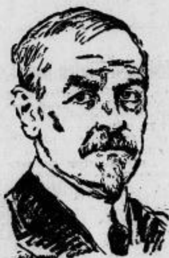
Nordenskiöld. Der bekannte schwedische Geograph Prof. Otto Nordenskiöld, der als Leiter verschiedener Expeditionen nach beiden Polen hervorgetreten ist, ist am 2. Juni in Göttingen an den Folgen eines Automobilunfalls gestorben.