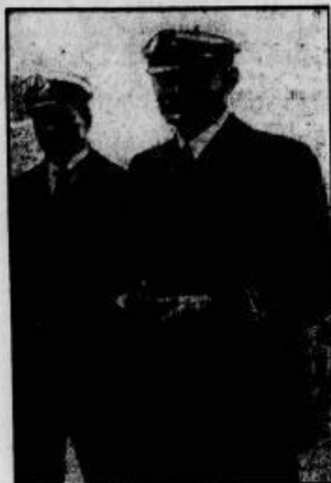
Zwei Helfer für die „Italia“. Der norwegische Flieger Dietrichson (links), der mit Amundsen in einem Dornier-Supermal-Flugboot das verschollene Luftschiff suchen wird, und der Flieger-Kapitän Barini, der von der norwegischen Regierung den Italienern gleichfalls im Flugzeug zu Hilfe gesandt wird.