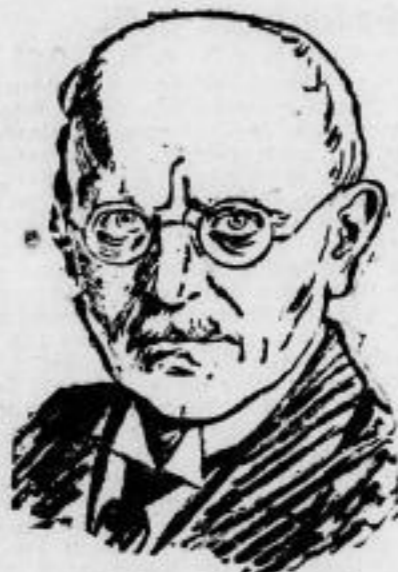
Ministerpräsident Selb 60 Jahre alt. Am 6. Juni vollendet der bayerische Ministerpräsident sein 60. Lebensjahr.