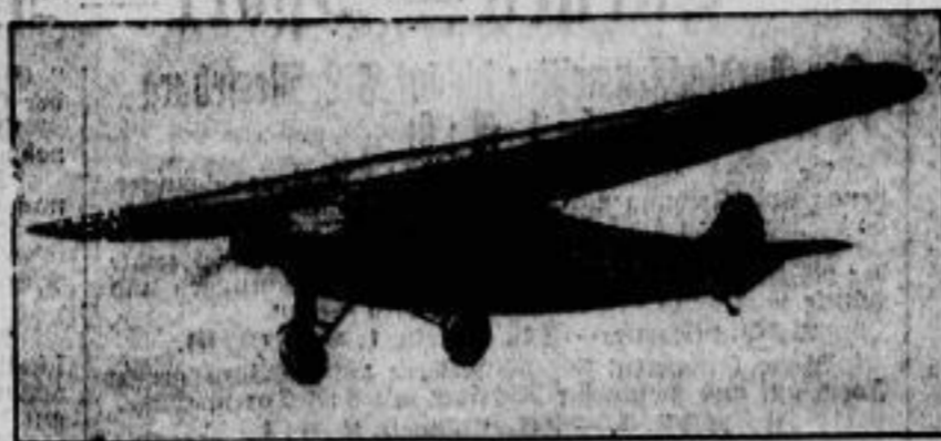
Der bisher längste Wasserflugzeug wurde von dem dreimotorigen Eindecker „Southern Cross“ („Kreuz des Südens“) mit dem Fluge von Honolulu nach den Fidji-Inseln, wo das Flugzeug am 4. Juni nach 86 stündiger Flugzeit glücklich ausgeführt. Die Strecke, die das „Kreuz des Südens“ in ununterbrochenem Fluge hiermit zurückgelegt hat, beträgt rund 6000 Kilometer.