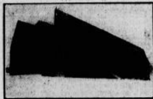
Abbau in Kingsbay. Da man jede Hoffnung auf eine Rückkehr der „Italia“ aufgegeben hat, wird die Segeltuchbekleidung der Luftschiffhalle in Kingsbay, in der die „Italia“ untergebracht war, von der Mannschaft des Expeditionsschiffes „Citta di Milano“ abgebaut.