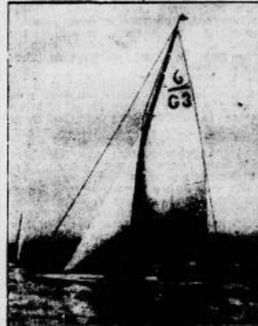
Ein deutsches Olympiaboot. Der Berliner Verein „Seglerhaus am Wannensee“ hat für die Segelregatta der Amsterdamer Olympiade ein Boot bauen lassen, das seit einigen Tagen seine Probefahrten auf dem Wannensee ausführt.