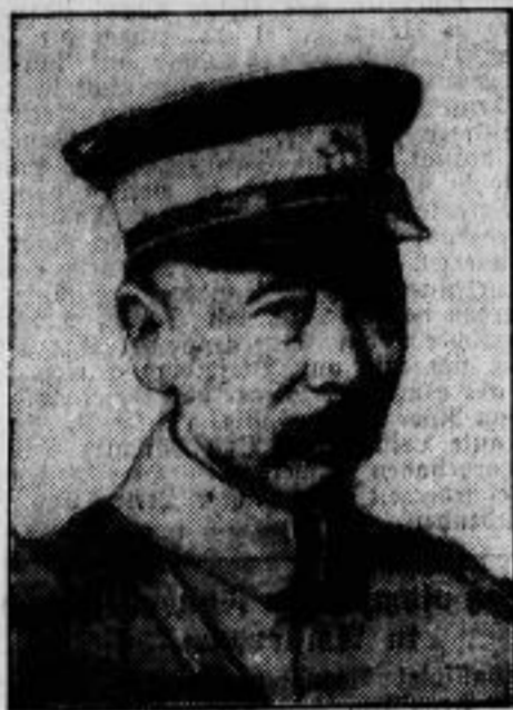
Zhang Xizhao. Der nordchinesische Diktator Marshall Zhang Xizhao ist den Verletzungen, die er bei dem am 4. Juni auf seinen Eisenbahnzug ausgeführten Bombenattentat erlitten hat, erlegen.