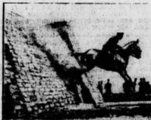
Reisefahrt in der mexikanischen Armee. Dieses Hindernis, eine hohe Steinmauer, mußten die Teilnehmer an dem Militärzeitturnier in Mexiko City passieren.