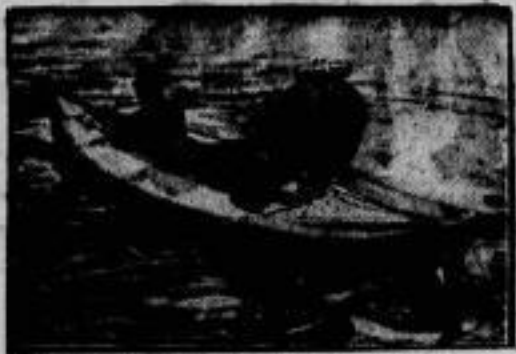
Ein neuartiges Schlauchboot mit Luftpropeller-Antrieb, das sich infolge seiner vielseitigen Verwendungsmöglichkeit bereits viele Freunde erworben hat.