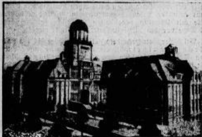
Die Technische Hochschule in Dresden beging vom 4.—6. Juni die Feier ihres hundertjährigen Bestehens.

Vom 13. Juni bis 13. Juli 1878 wurde in Berlin unter Deutschlands Vorsitz die als „Berliner Kongress“ bekannte Konferenz der europäischen Großmächte abgehalten, die die politische Gestaltung Ost-europas für mehrere Jahrzehnte festlegte. — Im Bilde: „Der Berliner Kongress“ von Anton von Werner. Links stehend: der russische Premierminister Fürst Gortschakow, rechts neben ihm stehend der englische Premierminister Lord Beaconsfield. In der Mitte Fürst Bismarck, links neben ihm der österreichisch-ungarische Außenminister Graf Andrássy. Ganz rechts der türkische Bevollmächtigte Mehmed Ali Pascha.