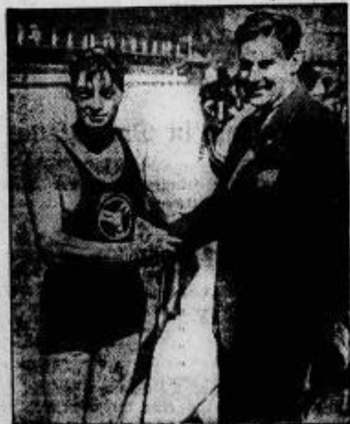
Johnny Weismüller schwimmt neuen Weltrekord. Der Amerikaner Johnny Weismüller, einer der besten Schwimmer der Welt, stellte einen neuen Weltrekord auf, indem er die 100-Meter-Strecke in 57 1/2 Sekunden schwamm.