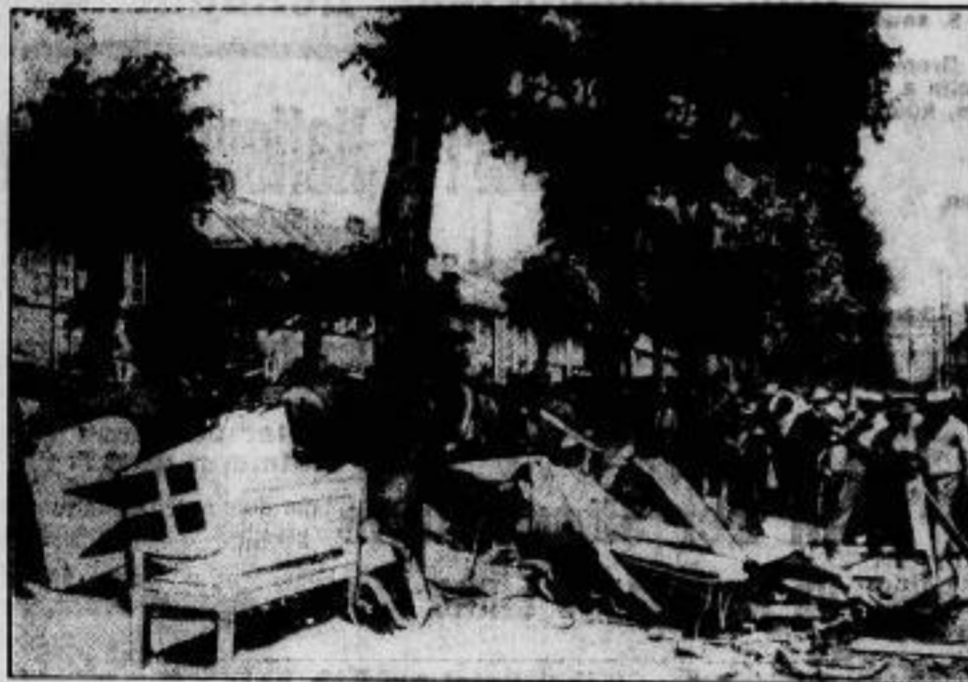
Absturz eines dänischen Militärflugzeuges über Kopenhagen. Ein Marineflugzeug stürzte über dem dichtbewohnten Kopenhagener Stadtteil Osterbro ab. Die drei Insassen, die vorher mit Fallschirmen abgesprungen waren, wurden gerettet, da sich die Fallschirme nicht entfalten. Im Bilde: Die Trümmer des Flugzeuges.