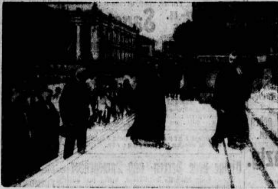
Reichspräsident von Hindenburg betritt den Dom anlässlich des Gottesdienstes, der zum erstenmal seit 1918 wieder der Eröffnung des Reichstages vorangeht.