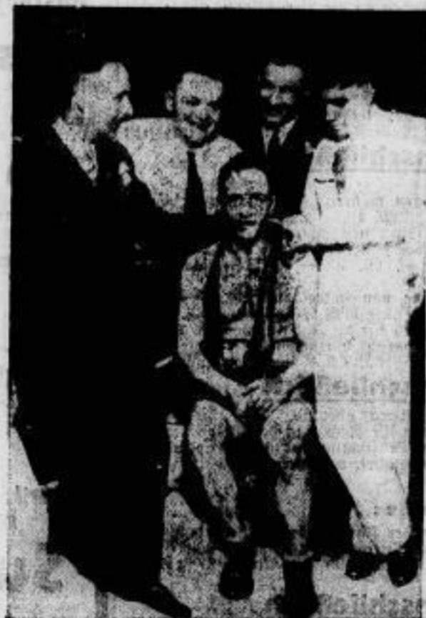
Der neue deutsche Schwergewichtsmeister.

Zur besonderen Ehrung der deutschen Ozeanflieger wurde vom Bayerischen Hauptministerium eine Medaille in Größe eines Fünfmarsstückes geprägt, die auf der Vorderseite die Großbildnisse der beiden Flieger, auf der Rückseite die „Bremen“ und das Goetebort „Allen Gefahren zum Trotz sich zu halten“ zeigt.