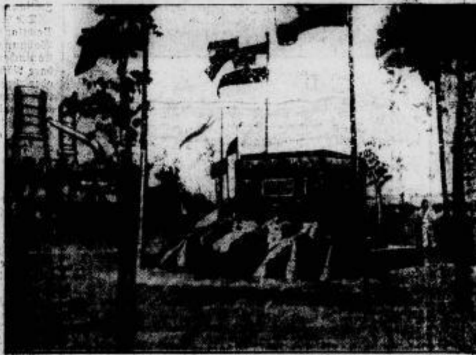
Ein Marine-Gefallenen-Denkmal, dessen Errichtung durch freiwillige Spenden der deutschen Nordseekreiskräfte ermöglicht wurde, ist vor dem Kriegsspiel der Minenschiffe im Nordhafen von Wilhelmshaven enthüllt worden.