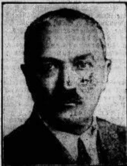
General Freiherr von Schoenich ist aus der Demokratischen Partei ausgetreten, weil er sich mit seiner Escadron für die Kriegsdienstverweigerung mit ihr in Widerspruch setzte.