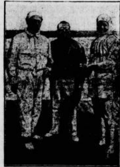
Vom Internationalen Motorbootrennen auf dem Templersee bei Potsdam.