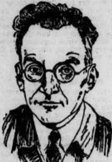
Geheimrat Prof. Richard Niemerschmid, der bekannte Maler u. Architekt u. Direktor der Kölner Werkstätten in München, wird am 20. Juni 60 Jahre alt.