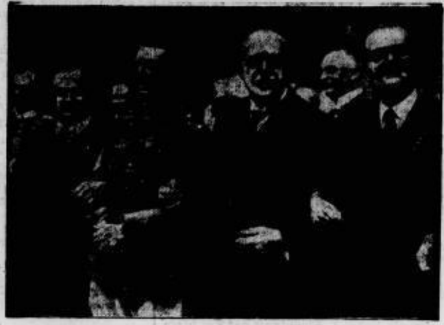
Die „Bremen“-Flieger wurden am 20. Juni vom Reichskanzler Dr. Marx in der Reichskanzlei empfangen. Im Bilde (von links nach rechts): Kühl, Fikmaurice, Reichskanzler Dr. Marx, Hünefeld.