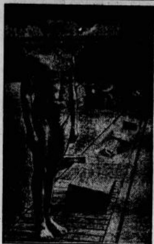
Arne Borg — das Schwimmmwunder! Der schwedische Meisterschwimmer Arne Borg, der kurzzeitig für die Olympiade trainiert, stellte kürzlich in Stockholm eine fast ungläubliche Rekordleistung auf, indem er die englische Meile (1609 Meter) in 21 Minuten 18,4 Sekunden durchschwamm und damit die erst vor einer Woche von dem Amerikaner Clarence Crabbes aufgestellte Weltbestzeit um 17,2 Sek. unterbot.