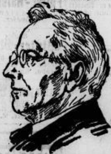
Peter Rosegger 10 Jahre tot. Am 26. Juni feiert sich der Todestag des reichlichen Volksdichters Peter Rosegger zum zehnten Male.