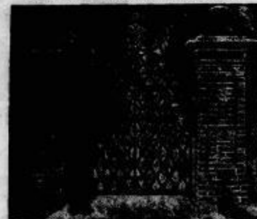
Ein Rosarium in Doorn. Der frühere Kaiser hat sich im Park von Doorn einen Rosengarten anlegen lassen, der jetzt dem öffentlichen Besuch freigegeben wurde. Im Bilde: das kunstvolle schmiedeeiserne Tor zum Rosengarten, ein Geschenk der Bewohner des Dorfes Doorn an den ehemaligen Kaiser.