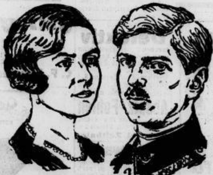
Prinz Carol geblieben. Auf Grund der Scheidungsklage der Prinzessin Helena von Rumänien, der Mutter des jugendlichen Königs Michael, gegen den Prinzen Carol wurde am 21. Juni die Ehe geschieden, wobei Prinz Carol als schuldiger Teil erklärt wurde. — Im Bilde: Prinzessin Helena und Prinz Carol.