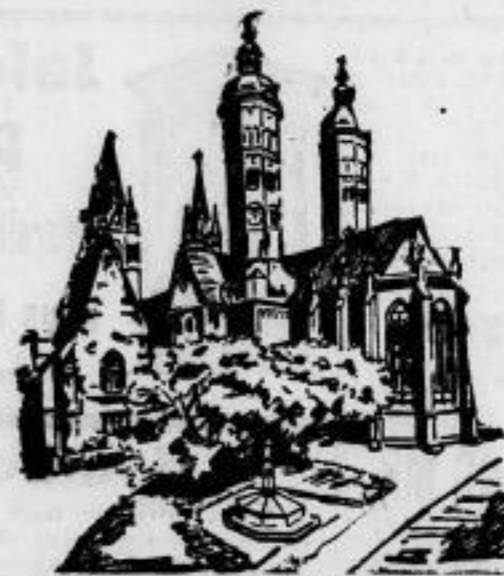
900-Jahrfeier der Stadt Raumburg. Raumburg a. d. Saale, dessen Wahrzeichen der herrliche, aus dem 13. Jahrhundert stammende Dom ist, feiert vom 22. bis 24. Juni sein 900-jähriges Stadtjubiläum. — Im Bilde: der Raumburger Dom.