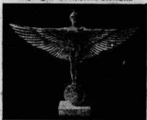
Schrengelstein für die Ozeanflieger. Die Sportausstellung in Berlin wird den zurückgekehrten Fliegern ein Werk des Bildhauers Hoch „Fluggöttin Nike“ als Schrengelstein überreichen.