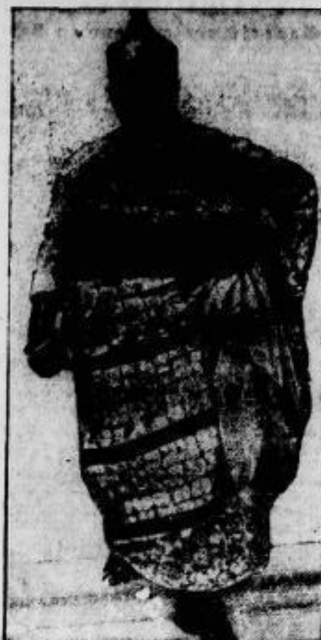
Der neueste englische Ritter. Der Königin Aita von Abukma (afrikanische Goldküste) ist in London eingetroffen, um vom englischen König geadelt zu werden.