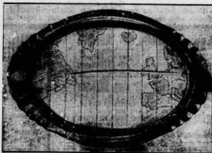
Die Schenkung der Reichsregierung an 1911. Ein handgetriebenes Silbertablett, dessen Gravierung den Flaggen der „Bremer“ zeigt, mit der Umschrift: „Schenkungs der Regierung des Deutschen Reiches an Hermann 1911. Dem ersten Segeltor der Ozean mit einem Flugzeug in der Richtung von Europa nach Nordamerika 1911.“