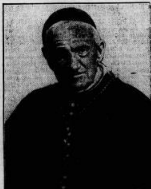
Kardinal Frühwirth begeht am 3. Juli sein Diamantenes Priester-Jubiläum.

Der englische Kreuzer „Dunlinch“ (im Bilde) ist im 2. Juli infolge dichten Nebels bei Halifax auf einen Felsen gelaufen. Da Abschleppversuche vergeblich waren und der Kreuzer als verloren betrachtet wird, mußte die Mannschaft von Bord gehen.