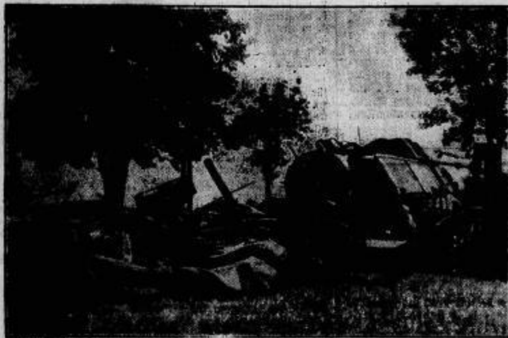
Die Verteilung bei Balkenried. Die Unglücksstätte — rechts die umgestürzte Lokomotive, davor die Trümmer des zerstörten Autobus.