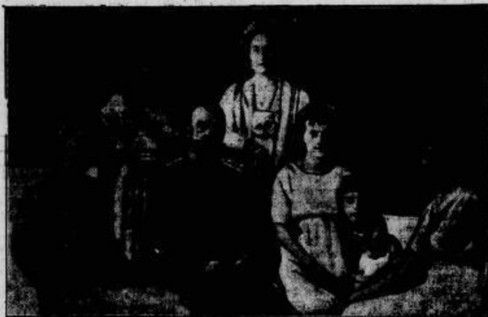
Vor 10 Jahren! Die Sarenfamilie, die in der Nacht vom 16. zum 17. Juli 1948 von den Bolschewiken ermordet wurde.