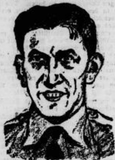
„Jung nicht, wenn die Götter lieben“. Der mexikanische Nationalheld, der zwanzigjährige Fliegerhauptmann Emilio Carranza, wurde bei der Rückkehr von seinem Fluge Mexiko-Washington, den er zur Erweiterung des Lindbergh-Fluges unternommen hatte, über New Jersey von einem schweren Gewitter überrascht und vom Blitz erschlagen.