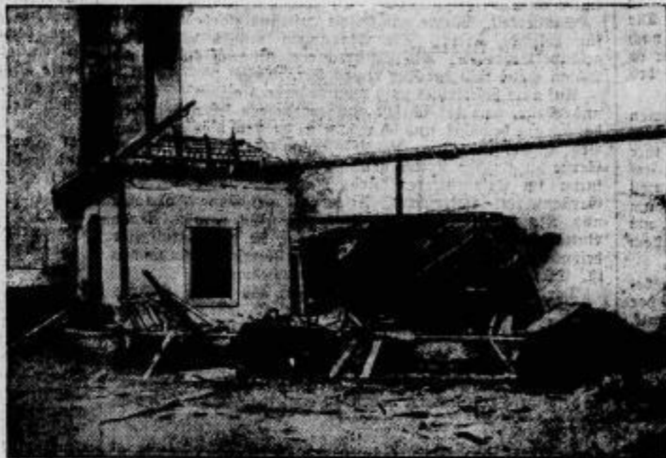
Explosionskatastrophe in Oshoch. Die Pulverfabrik in Oshoch a. M. lag am 14. Juli in die Luft. Durch die Explosion wurde eine Reihe von Arbeitern getötet oder verletzt. Das Maschinenhaus und mehrere Fabrikgebäude wurden zerstört. — Unser Bild zeigt die Trümmer des Maschinenhauses.