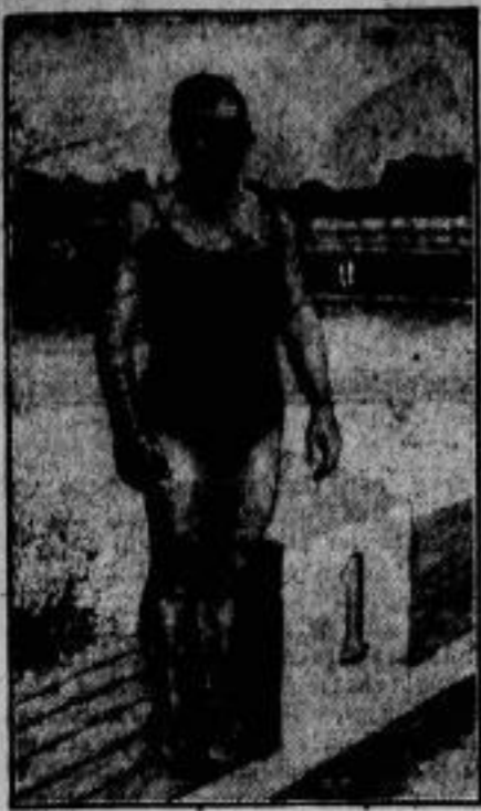
Danzelmacher („Westfalen“, Dortmund), der über die 800-Meter-, 1000-Meter- und 1500-Meter-Strecke drei neue deutsche Rekorde aufstellte. Zeiten: 11:25,9, 14:21, 21:39,7.