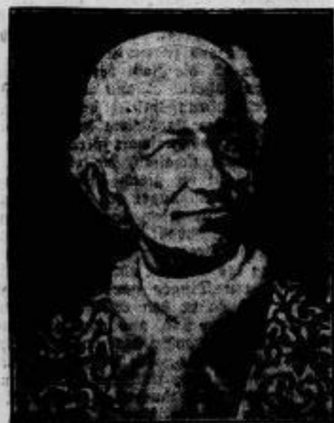
25. Todestag Papst XIII. Am 20. Juli sind 25 Jahre vergangen, seitdem Papst Leo XIII. seine Augen zur ewigen Ruhe schloß.