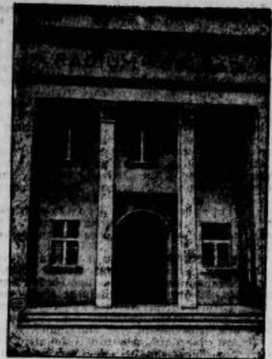
Bad Heidelberg. Am 15. Juli wurde in Heidelberg das Thermalbad eröffnet, in dem die schon 1918 erbohrte härteste Radium- und Lithiumquelle der Welt zu Bade- und Trinkkuren verarbeitet wird. Die ungünstige Wirtschaftslage der Stadt Heidelberg gestattete erst jetzt den Bau eines eigenen Badehauses. — Bild zeigen den Eingang zu dem neuen Heidelberger Brunnen- und Badehaus.