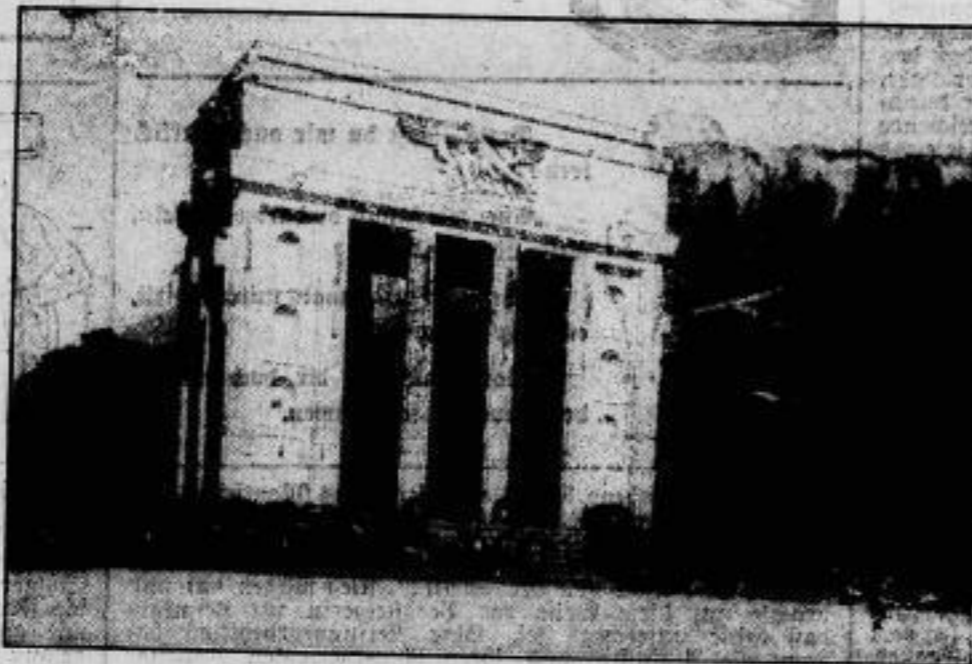
Das Italienische Siegesdenkmal in Vercelli wurde am 13. Juli in Gegenwart des Königs von Italien und zahlreicher Würdenträger des Königreichs feierlich eingeweiht. Im Bilde: Das Siegesdenkmal nach der Enthüllung.