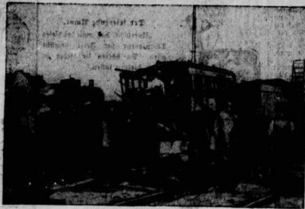
Wieder eine Eisenbahnkatastrophe. Die Trümmerstätte vor dem Münchener Hauptbahnhof nach dem Zusammenstoß am 15. Juli.