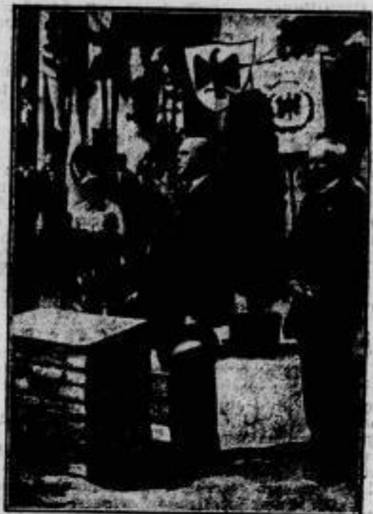
Der Deutsche Schwimmverband baut ein Haus. Am 13. Juli wurde auf dem Gelände des Sportforums in Berlin-Westend der Grundstein zu einem eigenen Hause des Deutschen Schwimmverbandes gelegt. — Im Bilde: Staatssekretär a. D. Kewal, der Präsident des Reichsausschusses für Leibesübungen, tut als Vertreter der Reichsregierung die drei Hammerschläge.