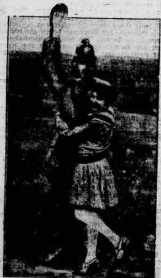
Ein unbesoldeter Wächter warnt die Kraftwagen vor einem Eisenbahnübergang in der Nähe von Saarow-Bielkow in der Mark. Die Uniform scheint auch in dieser Gestalt ein Wädchen aus dem Norden zu können.