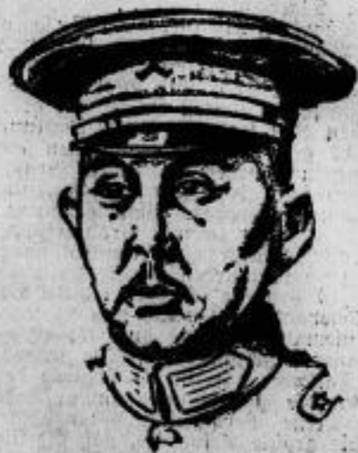
Der Militärgouverneur von Chinesisch-Turkestan erschossen. General Yangteng (im Bilde), der Militärgouverneur von Chinesisch-Turkestan, wurde in Kramtschi von der Gestapo des Kommandos für auswärtige Angelegenheiten erschossen.