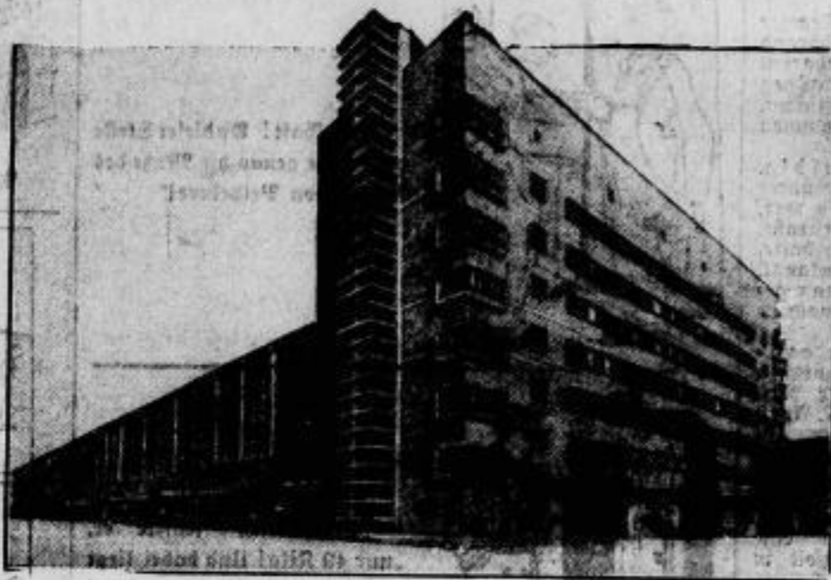
Beton — der Baustoff der Zukunft. In Frankfurt a. M. wurde die ganz aus Beton erbaute Großmarkthalle, die größte der Welt, in Betrieb genommen.