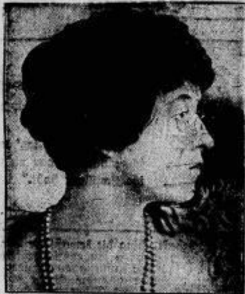
Mary Duncan ist der neue Star der Fox-Film-Corporation und wird sich in den neuen Filmen dieser Gesellschaft bald auch dem deutschen Publikum vorstellen.