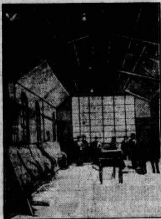
Die Einsturz-Katastrophe in Weimar. Der Saal im Weimarer Telegraphenamt, dessen 50 Meter lange Decke einstürzte, einen Telegraphensekretär erschlug u. mehrere Telephonistinnen verletzte. Man sieht links oben ein Stück der Decke, das an seiner Verankerung hängengeblieben ist.