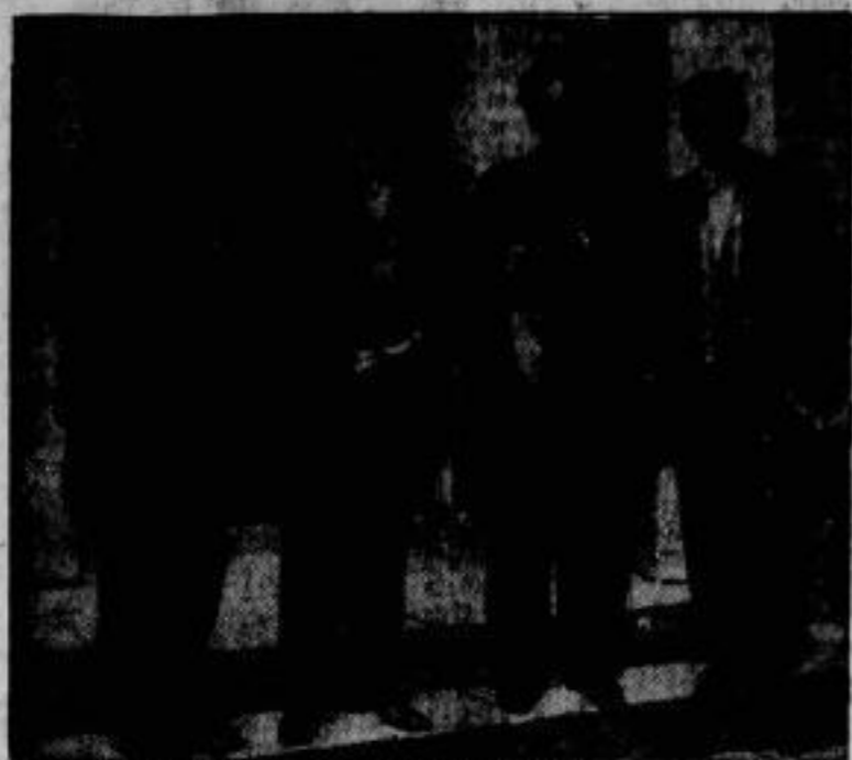
Erzbischof Soederblom — Ehrenbürger von Wittenberg. Die Lutherstadt Wittenberg hat anlässlich der Weihe ihres neuen Rathauses dem schwedischen Erzbischof Soederblom (der zweite von rechts), der auch in Deutschland sich allgemeiner Wertschätzung erfreut, zu ihrem Ehrenbürger ernannt.