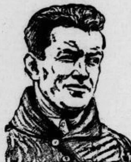
Er bleibt Weltmeister. Gene Tunney, der am 26. Juli seinen Herausforderer Tom Heenev in der ersten Runde L. o. schlug.