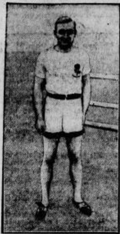
Lord Burgley, der „Blonde Lord“, der den 400-Meter-Gürdenlauf für England gewann.