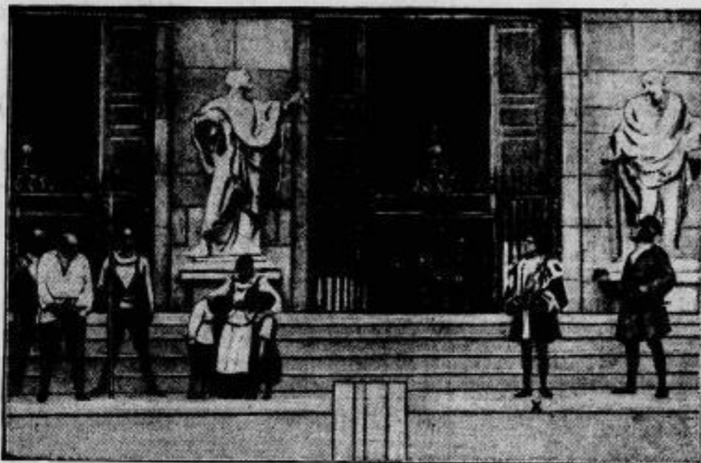
Die Salzburger Festspiele