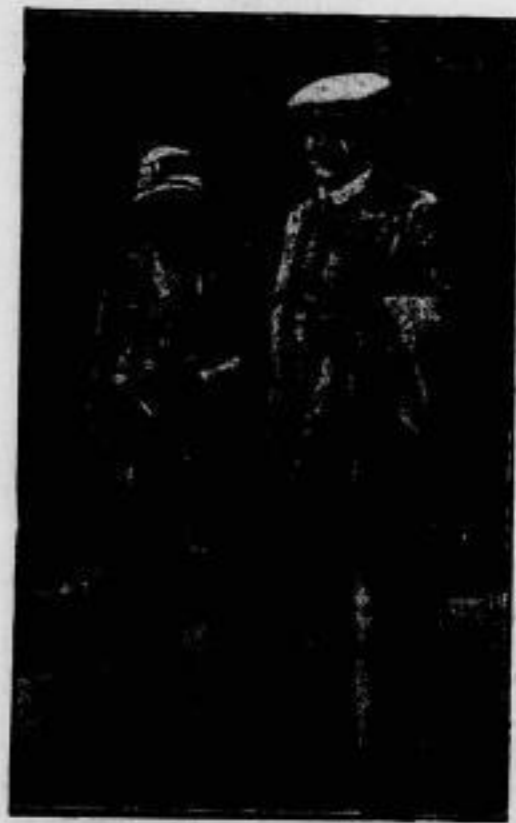
Aus dem Eise zurück.

ist das Expeditionsschiff „Samson“ des Polarforschers Nord, das dessen Südpolflug durch Anlage von Proviantdepots und Winterquartieren vorbereitet wird.