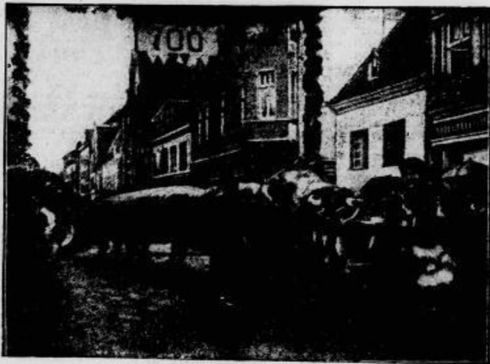
Die alte Stiefriedstadt Kempten... beginnt am 29. Juli die Feier ihres 700jährigen Bestehens. Der Festzug setzte hauptsächlich Episoden aus dem Nibelungenliede, so auch den Drachen, der zwar nichts von seiner Größe, aber viel von seinem Ingrimm verloren zu haben scheint.