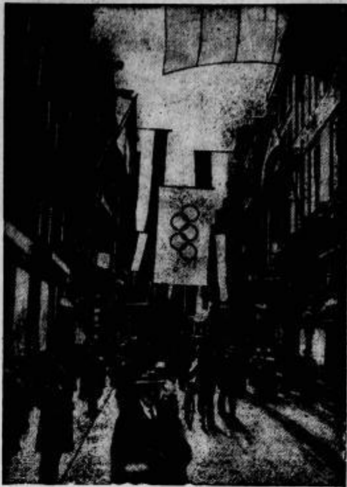
Strassenbild aus Amsterdam: die Kalverstraat, eine der Hauptgeschäftstrassen, die — wie die ganze Stadt — reichen Klagenschmuck angelegt hat.