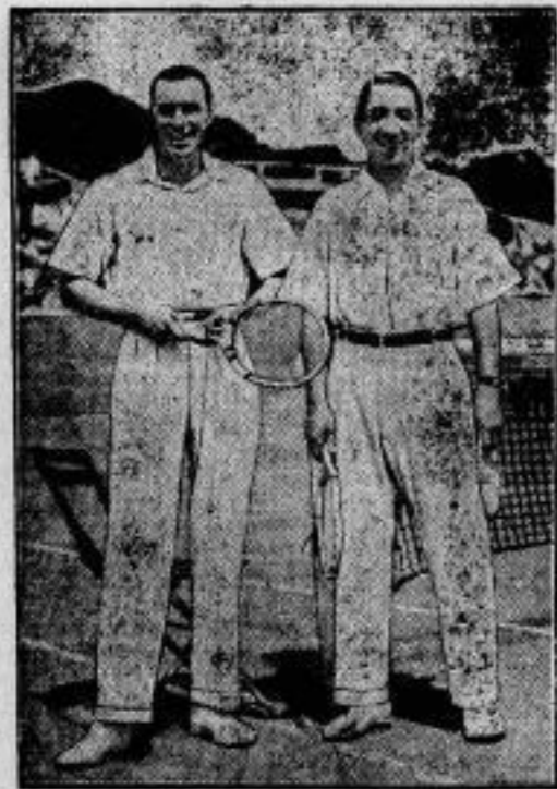
Um den Davis-Cup. Der Amerikaner Kildan (links) und der Franzose Jacotte nach ihrem Spiel um den Davis-Cup, in dem der Amerikaner seinen Gegner 1:0, 6:4, 6:4, 2:6, 6:3 schlug und damit für seine durch Jacotte erlittene Niederlage in Wimbledon Revanche nahm.