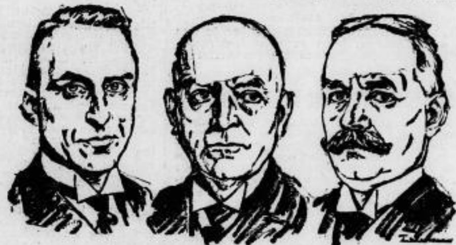
Neues Präsidium des Rheinlandsbundes. Die am 1. August in Berlin tagende Vertreterversammlung des Reichslandbundes wählte ein neues Präsidium, das aus dem früheren Reichsernährungsminister Schiele (rechts), dem bereits bisher im Präsidium befindlichen Reichstagsabgeordneten Dr. Dopp (links) und dem märkischen Bauerngutsbesitzer Bethge (Mitte) besteht.