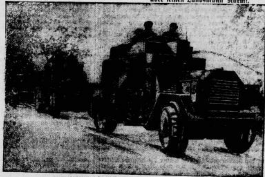
Die ersten hochleistungsfähigen Reichsbüchsen werden zur Zeit bei Göhring in Ostpreußen abgebaut. Im Bild: Kilmarch von Bangertrudingen.