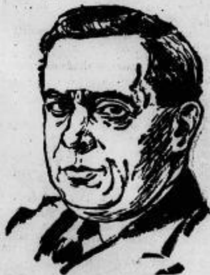
Der Berliner mexikanische Gesandte, der frühere Landwirtschaftsminister de Reges, kandidiert für den mexikanischen Präsidentschaftsposten und hat besonders gute Aussichten, da er das Vertrauen der sehr einflussreichen landwirtschaftlichen Kreise Mexikos in hohem Maße besitzt.