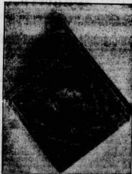
Der Reichsverband der katholischen Studentenvereine Deutschlands hielt in den ersten Augusttagen in Fulda seine 54. Vertreterversammlung ab. Bei dieser Gelegenheit überreichten die Altkamern ein von ihnen gestiftetes Verbandsbanner.