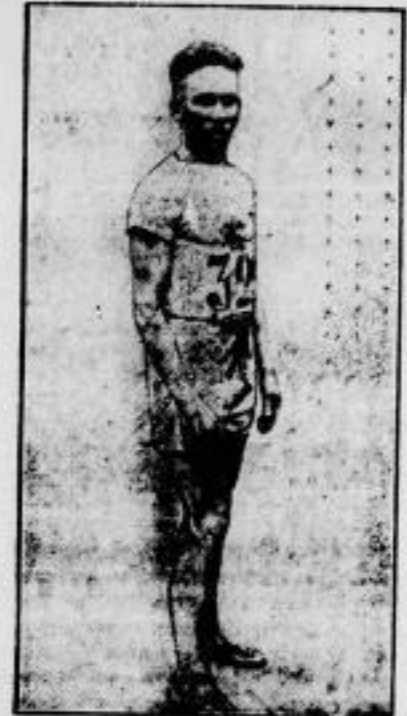
Der Finnländer Rittola nach seinem aufsehenerregenden Siege im 5000-Meter-Lauf über seinen Landsmann Hurmi.