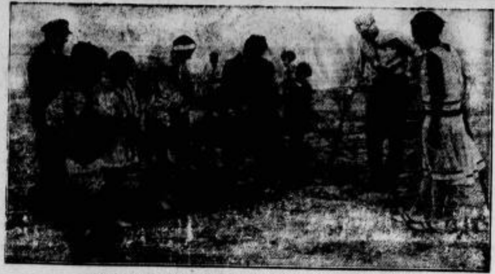
Nach dem Kampfen erholten sich die deutschen Olympiateilnehmer am Rorbekstrand bei ihrem Quartier Landvoort: König (in dunkler Sportwehe), 3. Sieger im 200-Meter-Lauf, und Meyer, der im Weitsprung den 4. Platz belegte, beim Profektspiel.