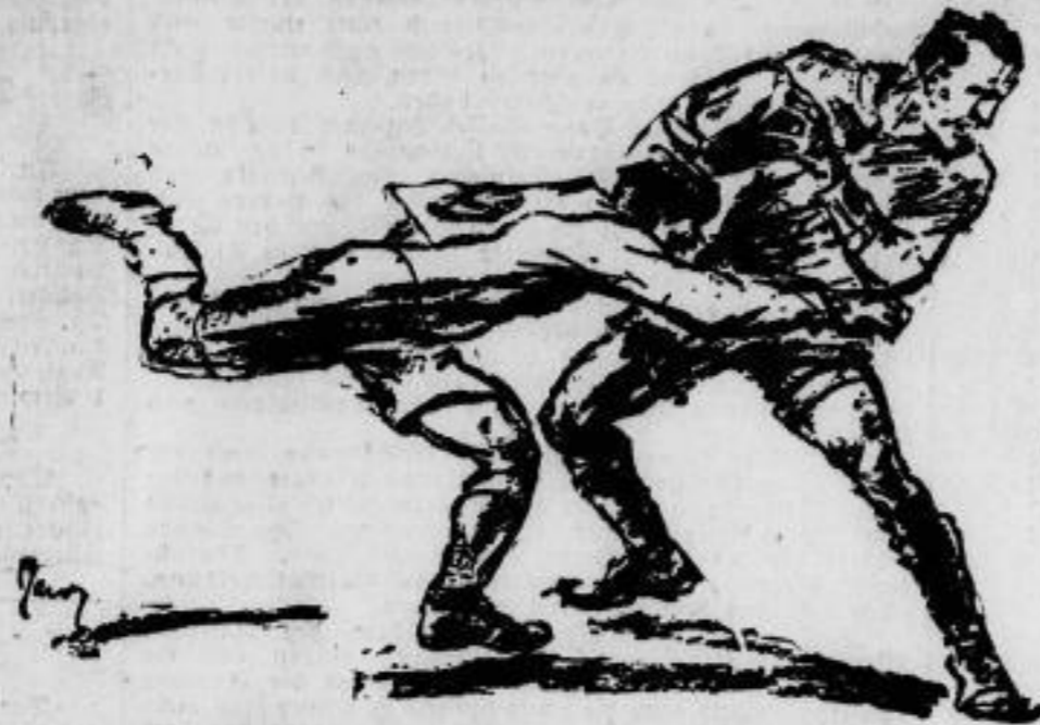
„Hochspringer“, eine Zeichnung von Jacoby, die bei Olympiakampfwettbewerb mit der Goldenen Medaille ausgezeichnet wurde.