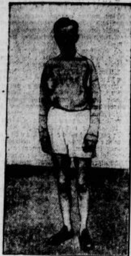
Der Finnländer Toukola, der das 3000-Meter-Hindernisläufen gewann.