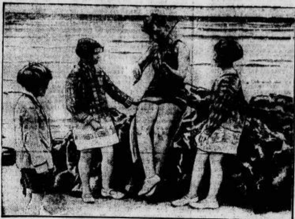
Die moderne Sirene.