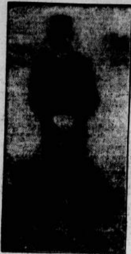
Gieger im Fünfkampf, der im Schießen, Fechten, Steilen, Laufen und Schwimmen ausgetragen wurde, ist der Schwedische Leutnant Ekfeld.