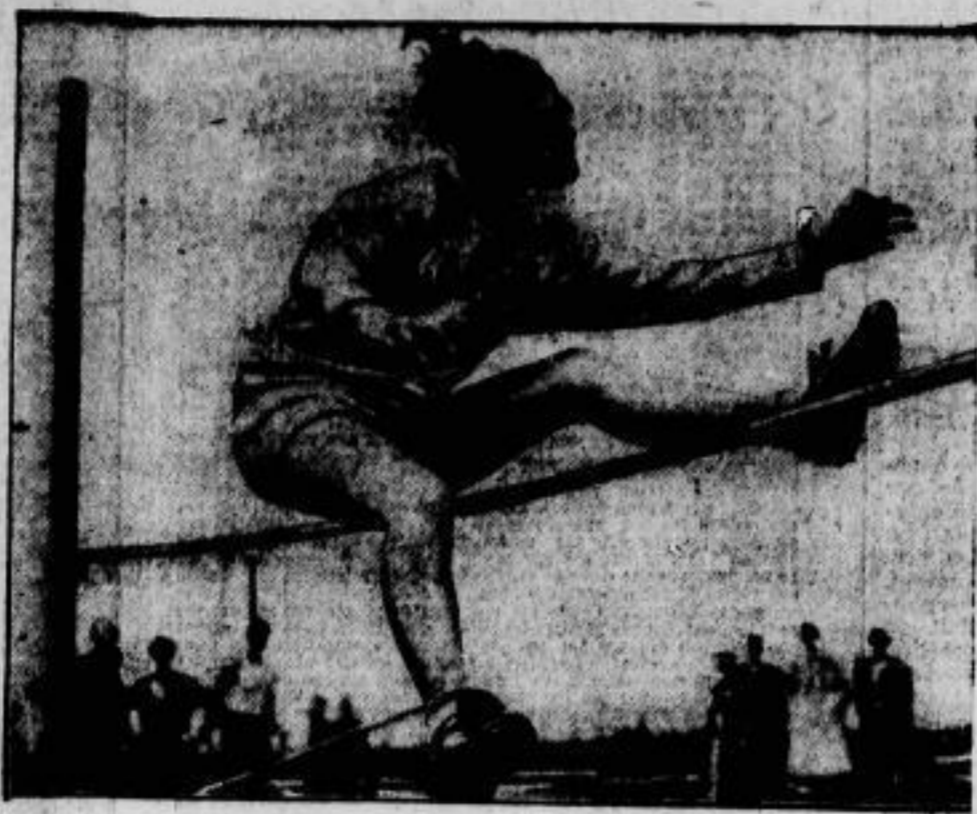
Von der Olympiade.