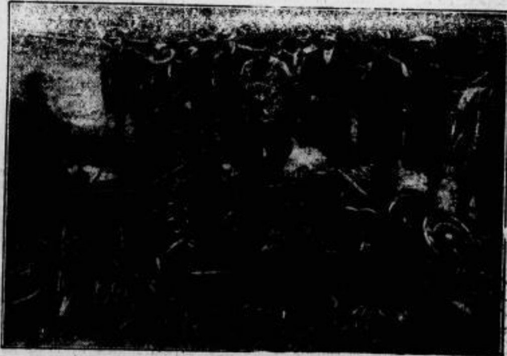
Dies ist alles, was von „Kaf 4“ übrig blieb.