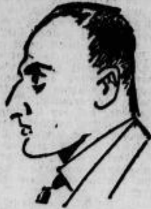
Der Münchener Reuter, der als Sieger im Dartsam- spiel eine goldene Me- daille nach Hause bringt.