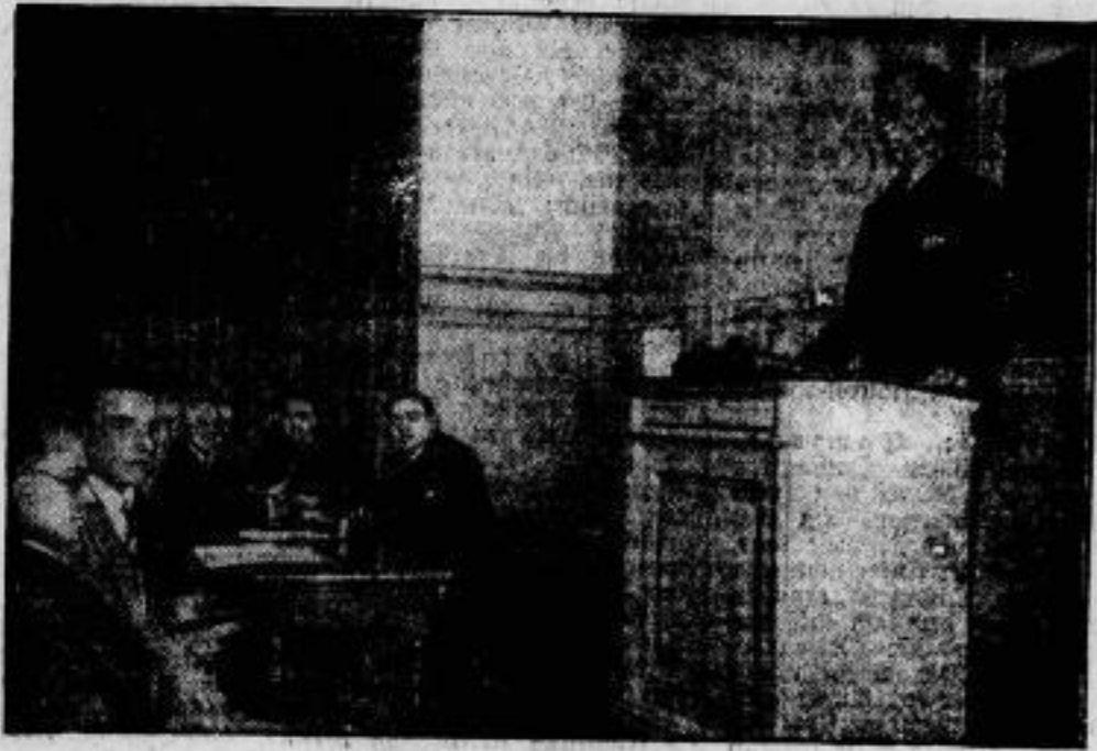
Redebeiträge der Primaner. Am 6. August begann in der Berliner Hochschule für Politik der Wettbewerb von 145 Primanern und Primanerinnen aus dem ganzen Reich, die über ein Thema aus der deutschen Verfassungsentwicklung sprachen. Nach einer Prüfung, die den Welten von der Spreu sondern soll, findet der endgültige Ausscheidungs- kampf am 10. August unter dem Vorsitz des Reichsinnenministers Severing statt. Der Sieger wird nach Washington geschickt, wo am 18. Oktober Schüler aller Kulturstaaten zu einem Redewettbewerb um die beste Verfassungsrede zu- sammenkommen.