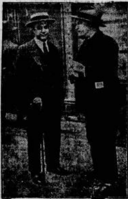
Capablanca in Berlin. Der frühere Schachweltmeister Capablanca (im Strohhut) ist von Paris zu vorüber- gehendem Aufenthalt in Berlin eingetroffen.