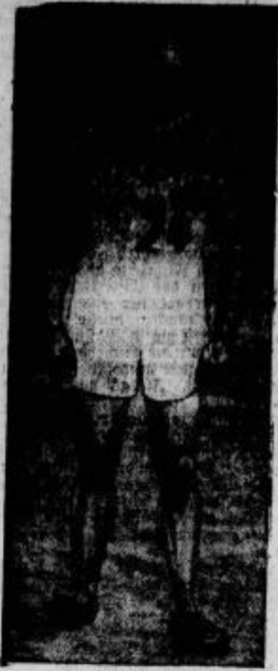
Der Sieger im Judo-Kampf, der Finnländer Naoto Ujio , der mit seinem Siege den bis- herigen Weltrekord erheblich überbot.