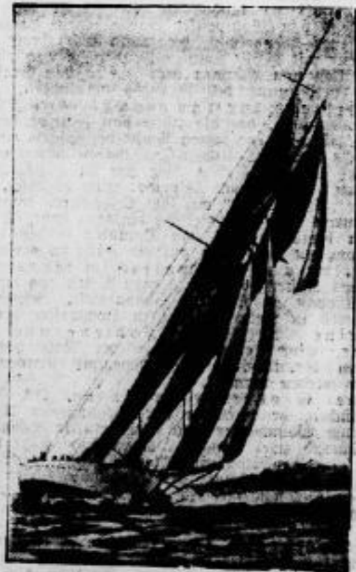
Die Segelregatta in Cowes, der klassische Weltkampf der großen Yachten in England, hat begonnen. Im Bild: die „Westward“ im 40-Meilen-Rennen.