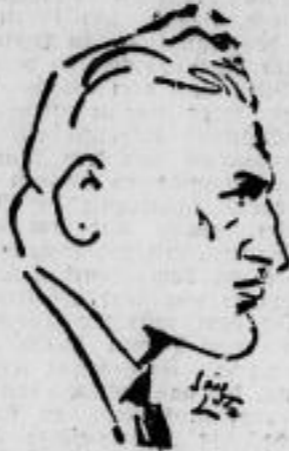
Der Deutsche Ringen, der im Halbschwergewichtsklasse eine silberne Medaille er- langt.