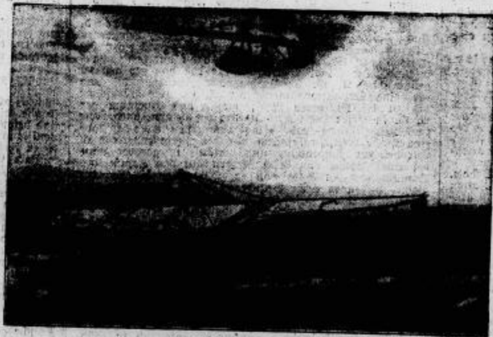
Segelflug in der Rhön. Die alljährlich, findet vom 1. bis 15. August der Rhön- Segelflugwettbewerb statt, bei dem am 6. August der Her- zogliche Jungflieger Kronfeld einen Höhenweltrekord von 540 Metern aufstellte.