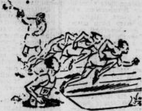
Olympische Kunst. Der Mann, der sein Startloch zu tief grub.