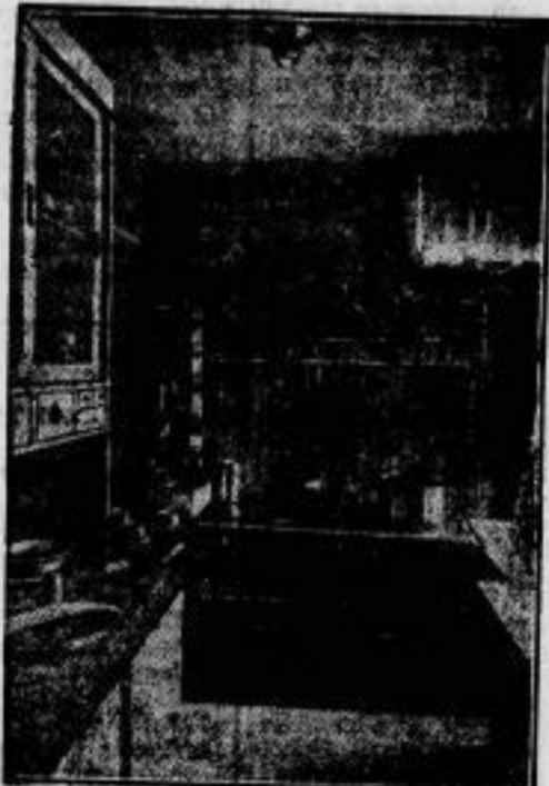
Die Küche, in der nur elektrisch gekocht wird.

Das neue deutsche Riesenluftschiff „Graf Zeppelin“ geht in der Friedrichshafener Werft seiner endgültigen Fertigstellung entgegen. — Die ersten Probeflüge werden noch Ende dieses Monats stattfinden.