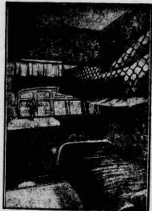
Dieselbe Kabine, als Schlafräum hergerichtet.