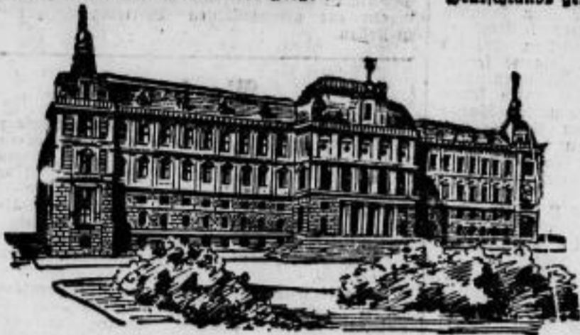
Der alte Justizpalast, der bei den Unruhen im Juli vorigen Jahres in Brand gesteckt wurde.