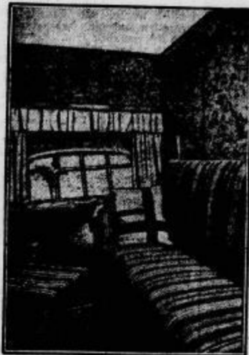
Passagierkabine bei Tage.