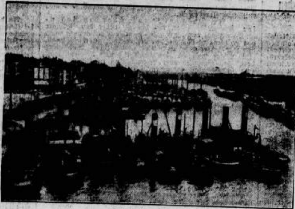
Stätten der Arbeit. Ausschnitt aus dem Düsseldorf Dahlen, der nach Fertigstellung seiner neuen Anlagen der größte Binnenhafen Deutschlands geworden ist.