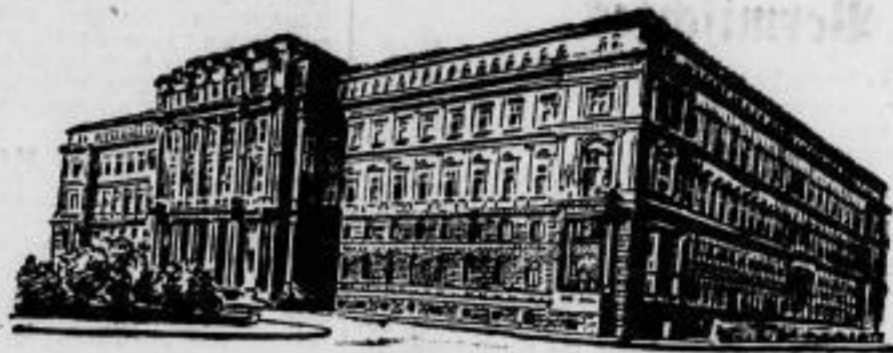
Wien baut seinen Justizpalast wieder auf.