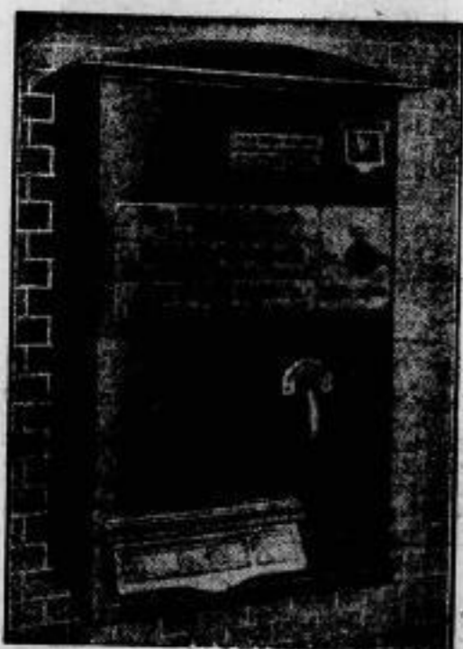
Die Reichspost wird demnächst Briefmarkenautomaten einführen, die dem Publikum den Kauf von einzelnen Wertzeichen erleichtern. Wir zeigen die verschiedenen vorgesehene Modelle, die gegenüber den bisherigen Konstruktionen technisch bedeutend vervollkommnet sind.