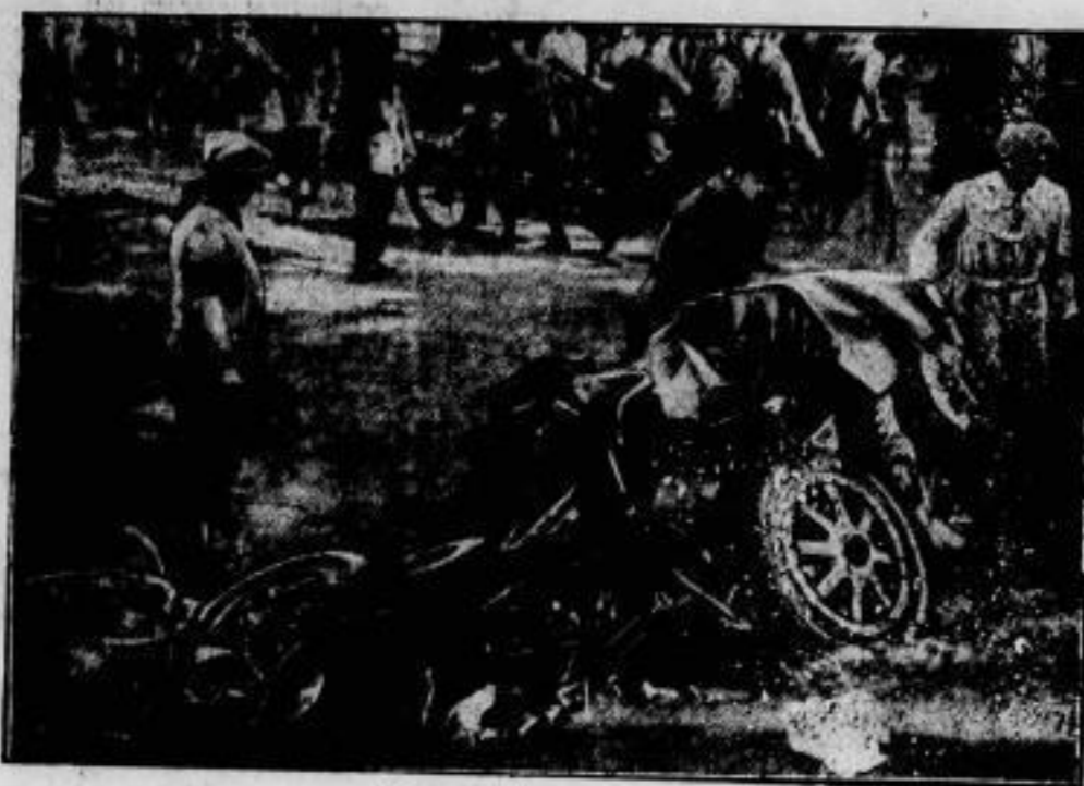
Der zertrümmerte Wagen.