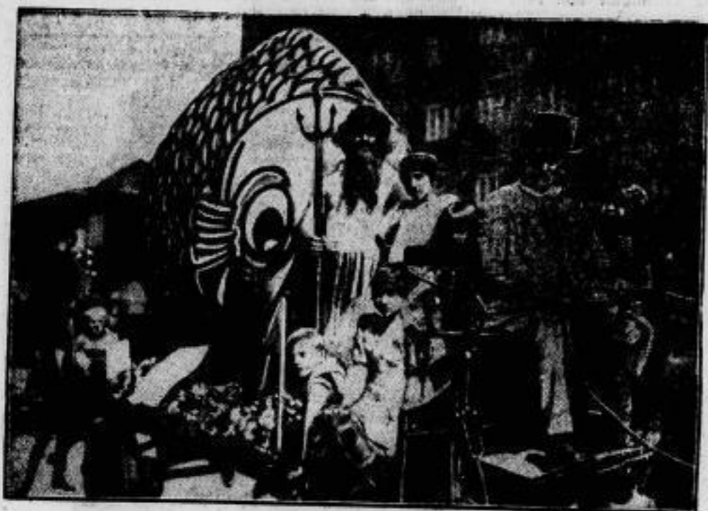
Der Stralauer Fischzug Ist seit Jahrhunderten ein sehr beliebtes Berliner Volksfest. Ursprünglich ein Fest des kleinen Fischerdorfes Stralau bei Berlin, ist der Stralauer Fischzug — nachdem sein Ursprungsort in Groß-Berlin aufgegangen ist — längst eine Feier für weite Kreise der Berliner Bevölkerung geworden. Im Bilde: das Wahrzeichen der Stralauer Fischer, ein fetter Karpfen, der im Festzuge der diesjährigen Feier am 19. August schwamm.