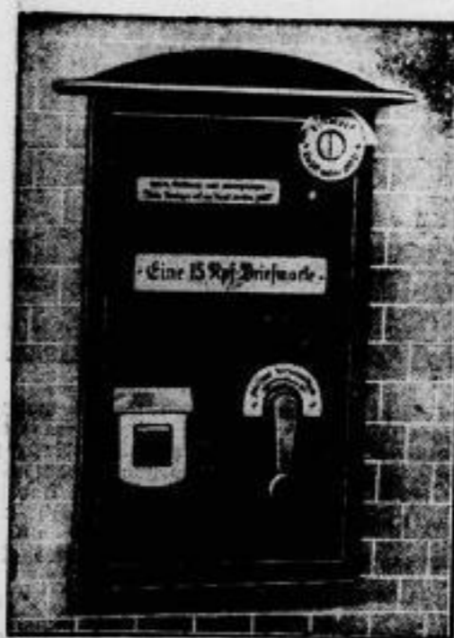
Links ein Mehrfachgeber, der 8- und 15-Pf.-Marken und 8-Pf.-Postkarten verkauft. — In der Mitte ein Säulendriefkasten, der Briefmarkenautomat und Briefkästen in sich vereinigt. — Rechts ein Einzelgeber, der entweder Marken oder Postkarten abgeben kann.