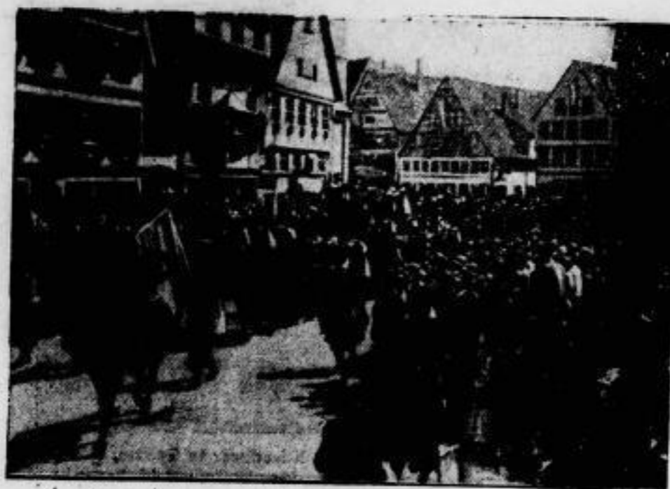
1000 Jahre Dinkelbühl. Der Festzug auf dem Marktplatz der Jubiläumstadt während der 1000-Jahr-Feier am 19. August.