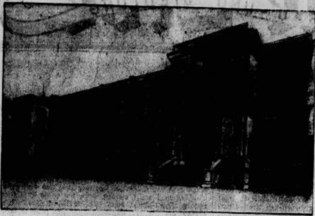
Der Ort der Unterzeichnung des Freigesetzes. wird das kaiserliche Amt am Quai d'Orsay zu Paris sein.