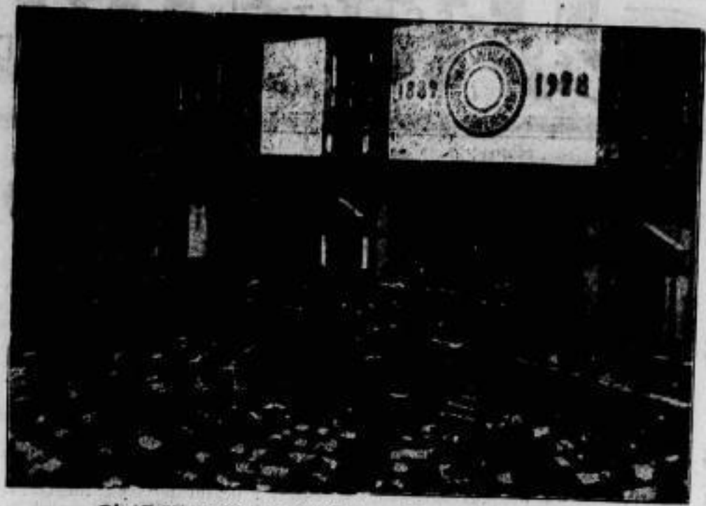
Die Eröffnungssitzung der Interparlamentarischen Union, zu der mehr als 500 Abgeordnete aus fast allen Staaten der Erde in Berlin zusammengekommen sind, fand am 23. Aug. im Plenarsitzungs-Saale des Reichstagsgebäudes statt.