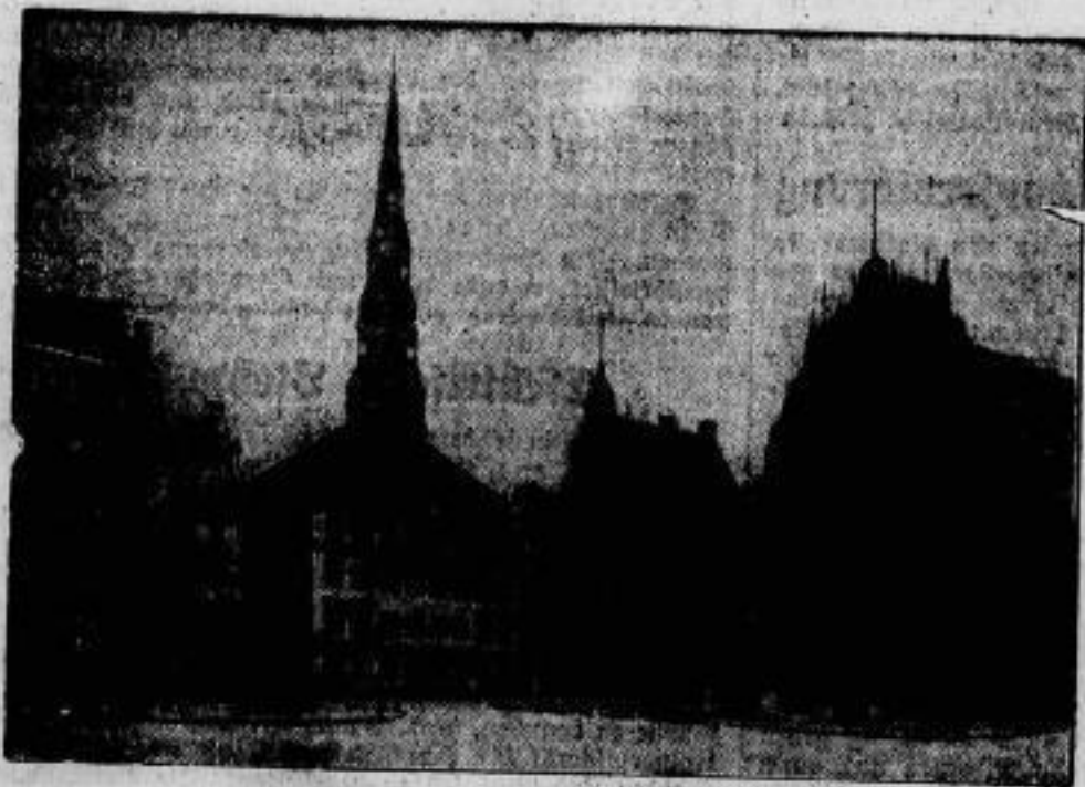
Der Schauplatz kommunistischer Mordtaten. Am 21. August kam es in Folge eines Verdicts des Prozesses der radikalen Gewerkschaften zu ersten Mordtaten. Große Arbeitermassen, die zum Gerichtsgebäude vorzubringen ver- suchten, konnten von der Polizei erst nach erbittertem Kampfe und nach Verhaftung von 400 Demonstranten aus- einandergezerrt werden. — Im Bilde: Der Rathhausplatz in Köln.