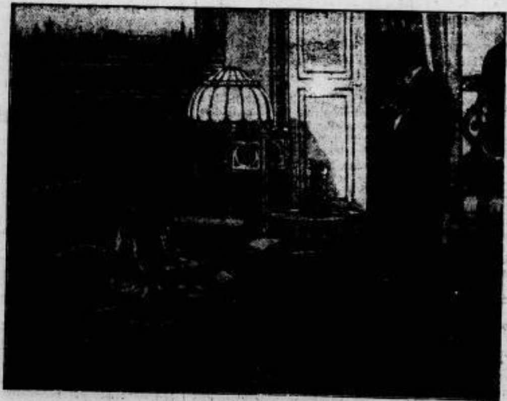
Ein Bild auf die Bühne. „Er liebt sie — er liebt sie nicht — er liebt sie —.“ So un- gefähr geht es in „Prinzessin Olala“ zu, einem sehr ver- günstigten Film, in dem die beiden Liebenden trotz aller Hindernisse zum Schluss Rab glücklich kriegen. „Prinzessin Olala“ wird demnächst die Uraufführung in Berlin erleben und dann im Reich gezeigt werden. — Im Bilde: Carmen Kraus und Walter Müller, die Träger der Hauptrollen.