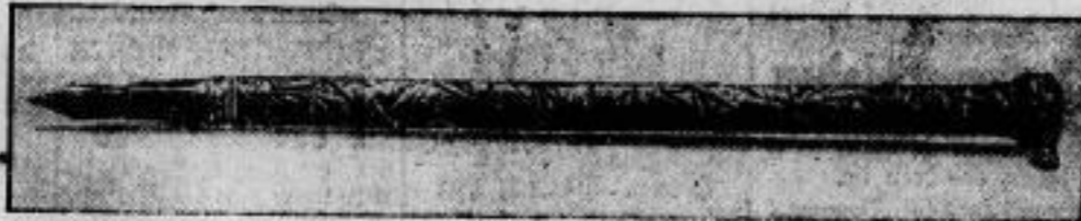
Das Friedensinstrument. Dieser goldene Füllfederhalter wird dem Staatssekretär Kellogg bei seiner Ankunft in Le Havre vom Bürgermeister der Stadt überreicht werden. Er ist das Werk eines Pariser Goldschmiedes und zeigt zwischen Olivenblättern 13 Sterne, die die ersten Staaten der Union symbolisieren. Seine Inschrift lautet: „Die Stadt Havre dem großen Arbeiter des Friedens, Sr. Excellenz Kellogg, August 1918“ und „Wenn du den Frieden willst, bereite ihn vor.“ Mit diesem Federhalter werden die Vertreter der Staaten den Kellogg-Pakt unterzeichnen.