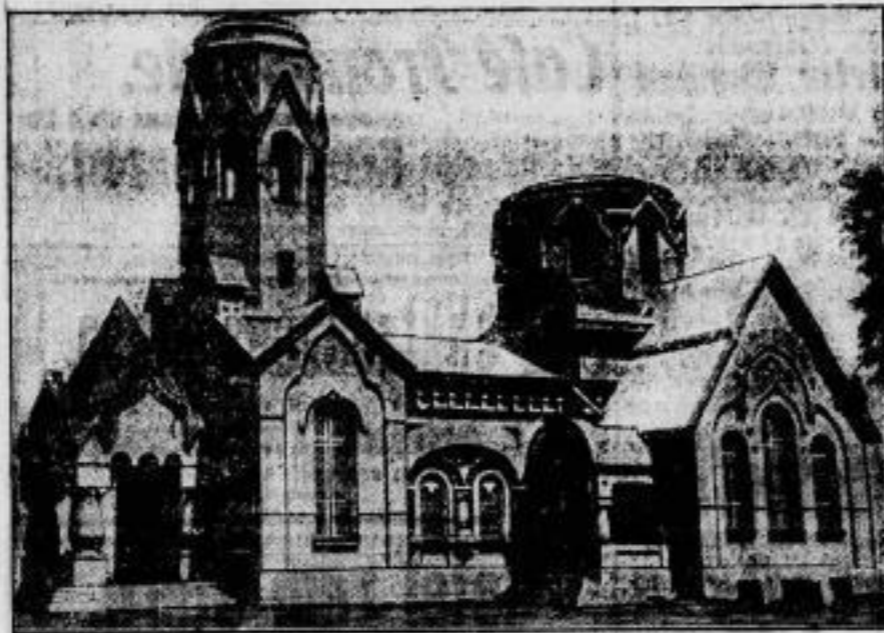
Das Schicksal der Kirchen in Rußland. Eine Kirche in Mariupol (Südrußland), die lange Zeit unbenutzt stand und jetzt als Heim eines Arbeiterklubs umgebaut wurde.