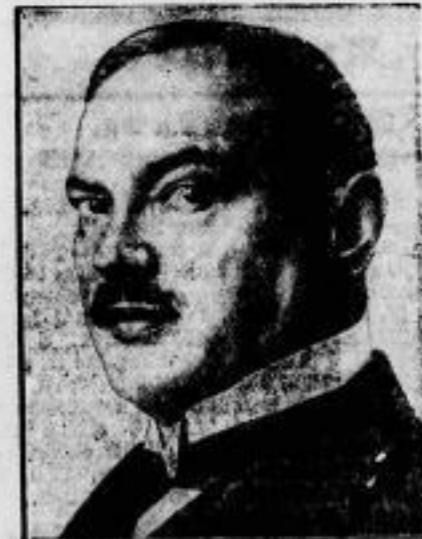
Franz von Stud. Der Maler Franz von Stud ist im Alter von 65 Jahren in München gestorben. Mit ihm verliert Deutschland eine seiner stärksten Begabungen auf dem Gebiete der Kunst aus der Zeit vor dem Impressionismus.