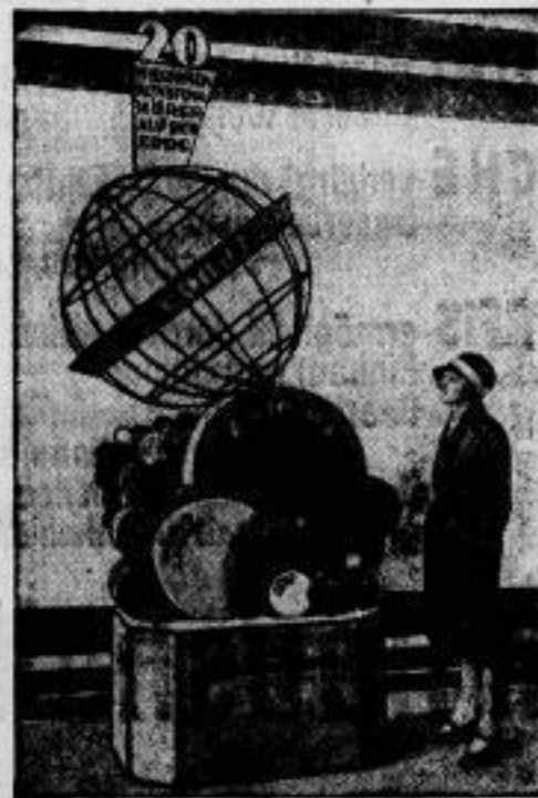
Die 5. Deutsche Ausstellung wurde in Berlin am 31. August eröffnet. Wir zeigen eine interessante Statistik, nach der es 20 Millionen Raubvögel auf der Erde gibt. In erster Stelle marschieren natürlich Amerika mit 7 1/2 Millionen Vögeln, während in größerem Abstande England und — an dritter Stelle — Deutschland mit je etwa 2 1/2 Millionen folgen.