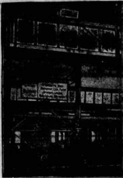
Auf dem Fernbahnhofs des Bahnhofs Zoologischer Garten in Berlin werden neuerdings die Waggons, die bisher durch einen Beamten ausgerufen wurden, durch Lautsprecher (im Bilde ganz oben) bekanntgegeben.