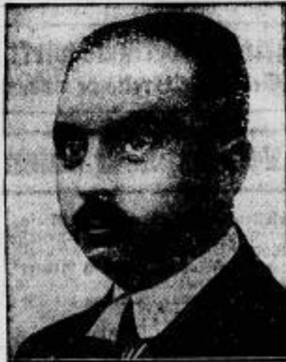
Raffolinski früherer Presschef, Major Cesare Rossi, ist von italienischen Agenten in einer in der Schweiz gelegenen italienischen Enklave verhaftet und ohne Genehmigung der schweizerischen Behörden über Schweizer Gebiet nach Italien gebracht worden. Rossi war seinerzeit in die Ermordung des Sozialisten Matteotti verwickelt, wurde verhaftet und flüchtete nach seiner Freilassung nach Frankreich, von wo aus er Mussolini der Mitschuld an diesem Verbrechen anlagte.