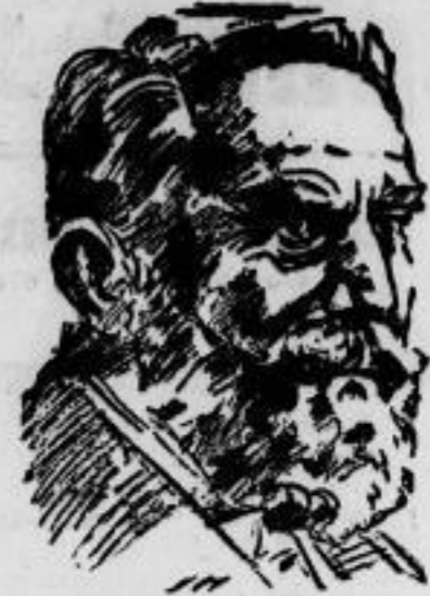
Ersellens von Miller, der Begründer des deutschen Museums in München, ist zum Ehrenpräsidenten der 1930 in Berlin stattfindenden Weltkraftkonferenz gewählt worden.