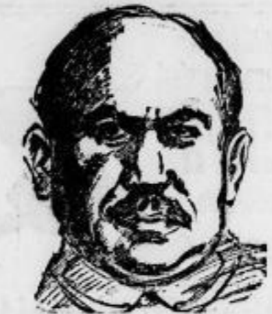
Neue Verwicklungen im Osten? Raschewitsch, der Befehlshaber der russischen Streitkräfte im Fernen Osten und Generaldirektor der Chinesischen Ostlichen Eisenbahn, ist wegen angeblicher Anzettelung des Mongolenaufstandes von den mandchurischen Behörden verhaftet worden und kurz darauf gestorben. Er soll entweder Selbstmord begangen haben oder von einem chinesischen Offizier erschossen sein. In Peking befürchtet man, daß wegen seines gewalttätigen Endes die Russen Gegenmaßnahmen ergreifen werden.