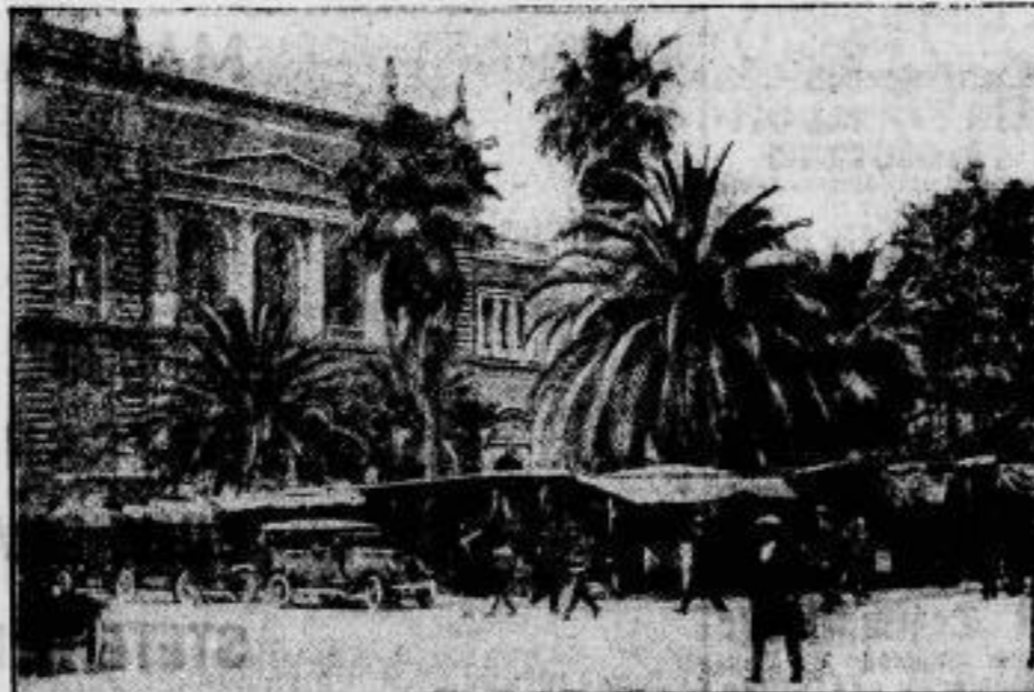
Eine verlebte Stadt In Athen, wo durch die Erkrankung von 100 000 Personen an einem epidemischen Typhus das gesamte öffentliche Leben stillgelegt ist. Wir zeigen das Opernhaus in Athen mit dem bevor aufgebauten Verkaufshäusern — ein Platz, der jetzt völlig verödet daliegt.