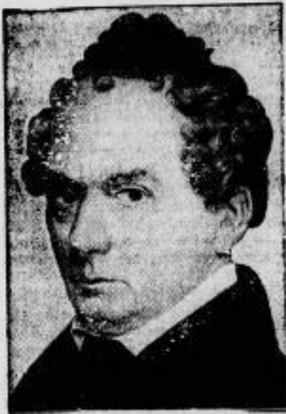
Clemens Brentano, einer der Dichter der romantischen Schule, wurde am 8. September vor 150 Jahren in Ehrenbreitstein geboren. Sein verdienstvollstes Werk ist die gemeinsam mit Achim von Arnim herausgegebene Sammlung deutscher Volkslieder, „Des Knaben Wunderhorn“.