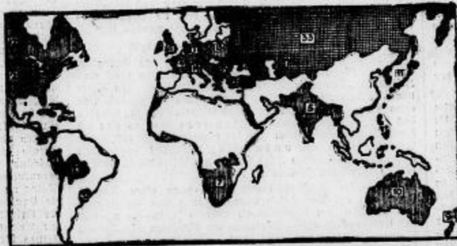
Der Kulchah an den Balkan-Pakt.

An der feierlichen Unterzeichnung des Balkan-Paktes in Paris haben folgende Staaten teilgenommen (Serbien (Serbien)): 1. Deutschland, 2. Vereinigte Staaten, 3. Belgien, 4. Frankreich, 5. Großbritannien und Indien, 6. Irland, 7. Schweden, 8. Tschechoslowakei, 9. Neuseeland, 10. Australien, 11. Japan, 12. Kanada, 13. Polen, 14. Italien, außerdem haben ihren Beitritt oder ihre Bereitschaft zum Beitritt erklärt (ausdrückt): 15. Österreich, 16. Niederlande, 17. Dänemark, 18. Finnland, 19. Rumänien, 20. Ceharica, 21. Peru, 22. Bolivien, 23. Kuba, 24. San Domingo, 25. Jugoslawien, 26. Griechenland, 27. Schwiz, 28. Türkei, 29. Liberia, 30. Luxemburg, 31. Panama, 32. Uruguay, 33. Rußland.