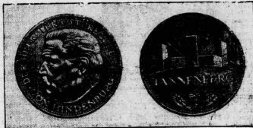
Eine Hindenburg-Lauenberg-Gedenkmünze wurde zugunsten der Hindenburg-Spende geschaffen. Links die Vorder-, rechts die Rückseite.