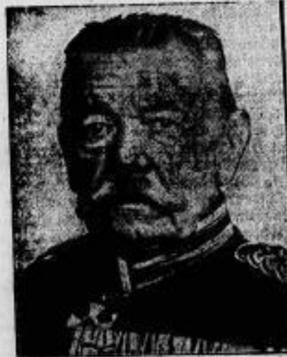
Generaloberarzt Dr. Gering †. Am 30. August starb in Potsdam Generaloberarzt a. D. Dr. Gering kurz vor Vollendung seines 84. Lebensjahres. Dr. Gering hat sich mit der Gründung des Verbandes freiwilliger Sanitätskolonnen und mit der Organisation des deutschen Roten Kreuzes bedeutende Verdienste erworben.

An der feierlichen Unterzeichnung des Balkan-Paktes in Paris haben folgende Staaten teilgenommen (Serbien (Serbien)): 1. Deutschland, 2. Vereinigte Staaten, 3. Belgien, 4. Frankreich, 5. Großbritannien und Indien, 6. Irland, 7. Schweden, 8. Tschechoslowakei, 9. Neuseeland, 10. Australien, 11. Japan, 12. Kanada, 13. Polen, 14. Italien, außerdem haben ihren Beitritt oder ihre Bereitschaft zum Beitritt erklärt (ausdrückt): 15. Österreich, 16. Niederlande, 17. Dänemark, 18. Finnland, 19. Rumänien, 20. Ceharica, 21. Peru, 22. Bolivien, 23. Kuba, 24. San Domingo, 25. Jugoslawien, 26. Griechenland, 27. Schwiz, 28. Türkei, 29. Liberia, 30. Luxemburg, 31. Panama, 32. Uruguay, 33. Rußland.