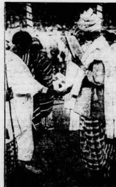
Ein Somali-Häuptling heiratet. Ein Häuptling der Somali-Truppe, die jetzt im Berliner Zoologischen Garten als Völkerschau gezeigt wird, hat mit einer jungen Stammesgenossin die Ehe geschlossen. Wir zeigen die Krönung des Paares durch den Somali-Vizeleiter. Interessant ist, daß das Zeremoniell hierbei die Verschleierung der Braut fordert.