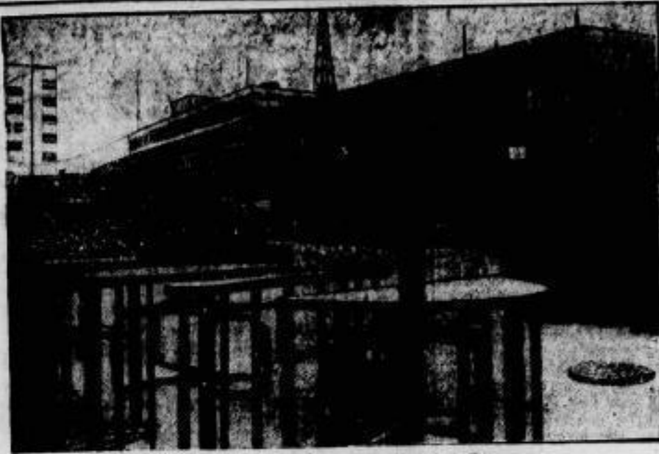
Vom Fliegen ins Bett — vom Bett ins Fliegen. Die lange geplante Vergrößerung des Berliner Flughafens wird jetzt durchgeführt. Der fast fertiggestellte Erweiterungsbau (im Bilde) von 110 Meter Länge wird außer neuen Diensträumen für die Deutsche Luftlinie, die Berliner Flughafen-Gesellschaft, die Flugwetterwarte und die Nitrova ein Hotel enthalten, in dem die nachts ankommenden Luftreisenden sofort übernachten können.