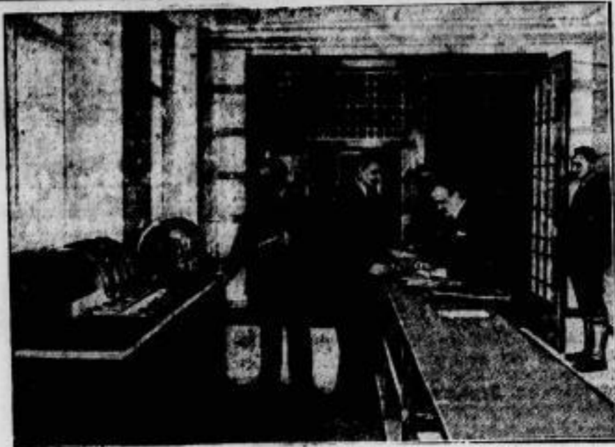
Das Reichsbahn-Neutralamt in Berlin hat einen Erweiterungsbau erhalten, der mit allen in Bürohäusern erprobten technischen Neuerungen ausgestattet ist. So werden Besucher durch eine Rohrpostanlage (links) angemeldet. Die im Hintergrunde sichtbare Differenztafel leitet dem im Empfangsraum diensttuenden Beamten durch verschiedenfarbige Lichtsignale, ob der Reisende, den ein Besucher zu sprechen wünscht, im Zimmer, in einer Besprechung, im Hause oder außer dem Hause ist.