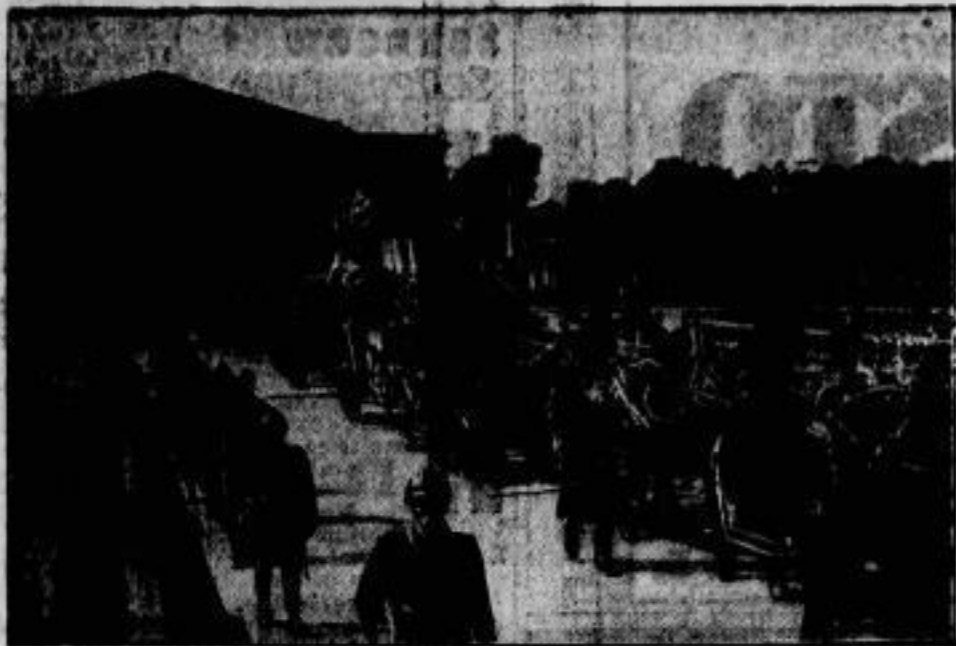
Das Begräbnis des französischen Handelsministers Dolanowski. der kürzlich durch einen Absturz mit dem Flugzeug ums Leben kam, fand in Paris in der ehrenvollsten und feierlichsten Form statt. Die gesamte Regierung, das Diplomatik-Korps und die Vertreter von Behörden und Armee folgten dem Leichensarg, den wir auf dem Wege zum Montmartre-Friedhof beim Pont de la Concorde zeigen.