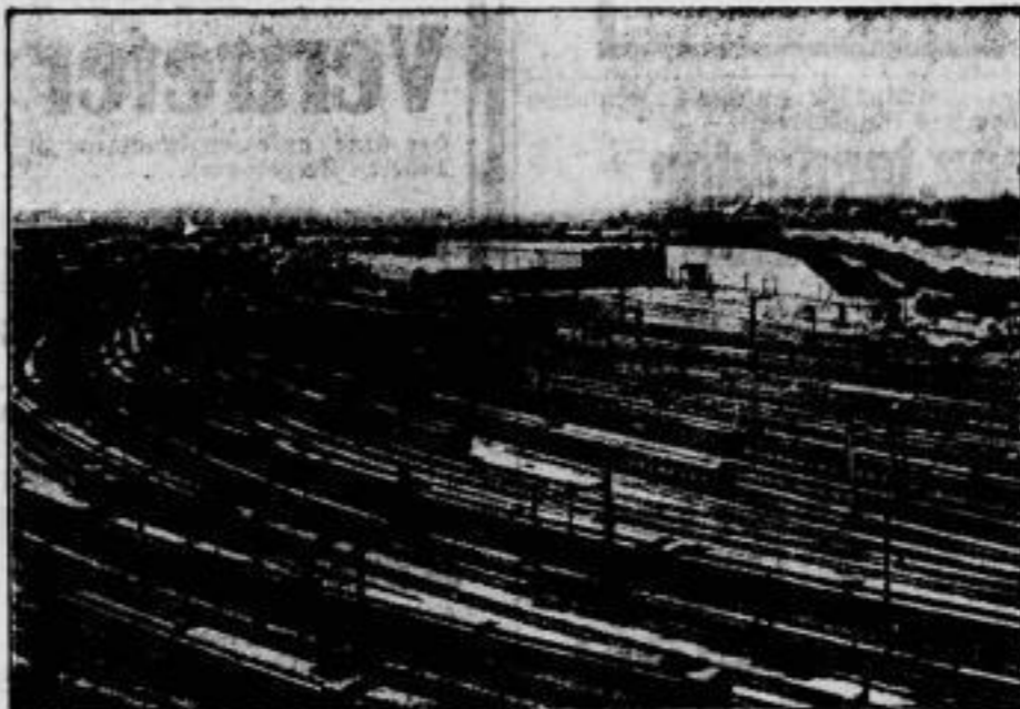
Stätten der Arbeit. Der Rangierbahnhof von Melbourne, auf dem die Züge nur durch elektrische Kraft — also ohne Dampflokomotiven — rangiert werden. Das Bild gibt einen überzeugenden Eindruck von der technischen Entwicklung Australiens.