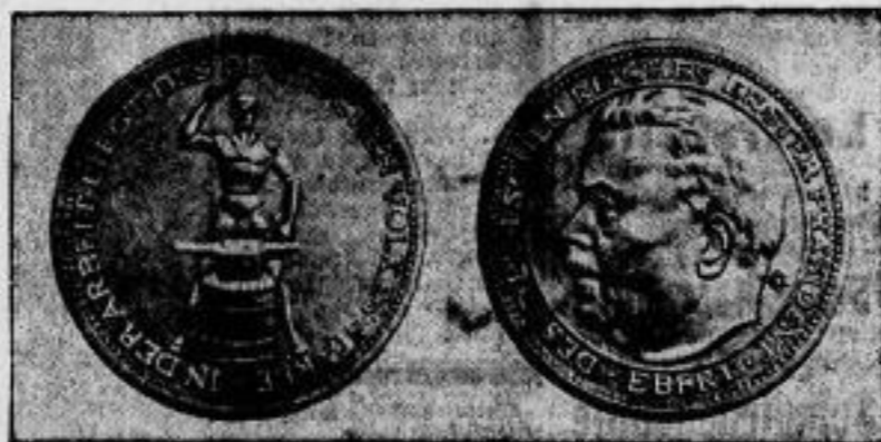
Eine Herrschermedaille wird von der Preussischen Staatsmünze in 5-Markstück-Größe in Bronze und in Silber geprägt. — Rechts die Vorder-, links die Rückseite.