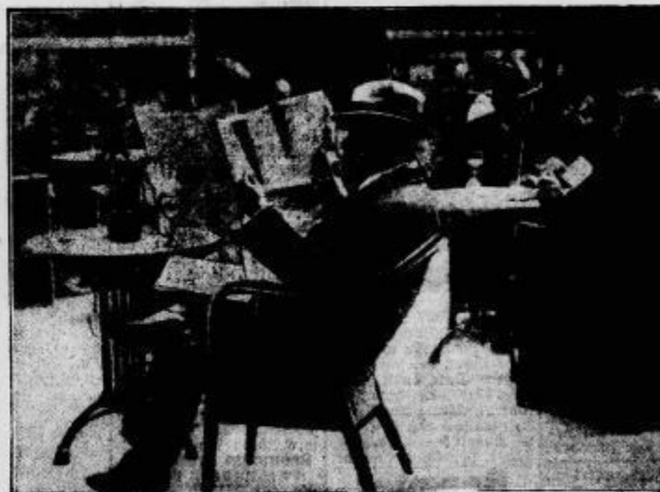
Reichsaussenminister Dr. Stresemann hält sich zurzeit in Baden-Baden zur Nachkur auf, um endgültige Erholung von seiner schweren Erkrankung zu suchen. Wir wünschen baldige Genesung!