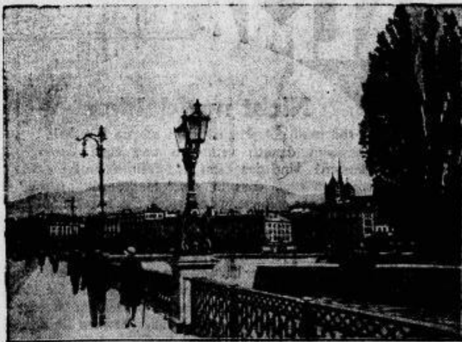
Zwischen den Sitzungen des Völkerbundes. Ein Bild aus Genf. Links die Rhonebrücke, rechts die Nouvelle-Jusel.