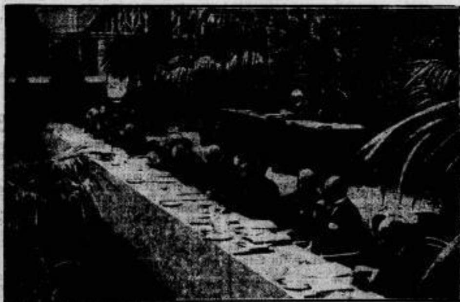
Die Bankiers in Köln.

Vom 9. bis 12. September fand in Köln der 7. Allgemeine Deutsche Bankiertag statt, der überaus zahlreich besucht war. Im Bilde: Der Vorstandstisch während der Schlussbankung.