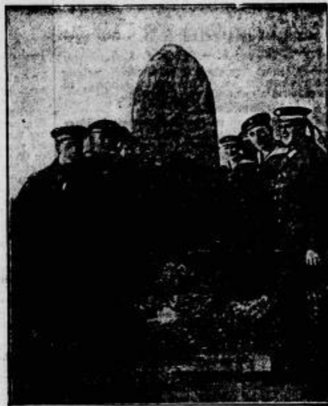
Zum Gedenken der Toten der Slagerrak-Schlacht besuchte die deutsche Hochseeflotte am 9. September die deutschen Gräber in Slagen (Dänemark) und legte dort Kränze nieder.