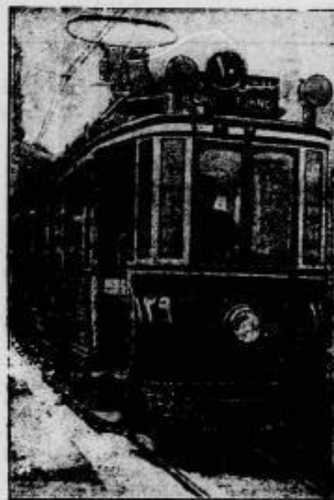
Modernes Türkei. Der türkische Diktator Kemal Pascha führt die Modernisierung seines Landes mit allen Kräften durch. So will er neuerdings die türkische Schrift durch die lateinische erlösen. Alle Beamten und Offiziere müssen die abendländischen Schriftzeichen lernen, die — wie unser Bild zeigt — auch die Schilber der Straßenbahnen erobert haben.