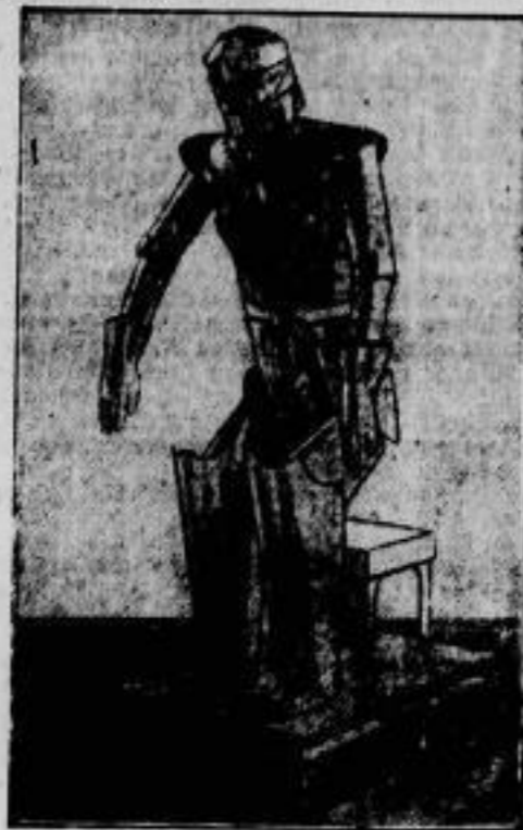
Ein künstlicher Mensch. „Robot“ genannt, eröffnete die diesjährige Londoner Modellausstellung durch eine Rede. „Robot“ kann auf Befehl die Hand geben, aufstehen, sich hinsetzen, gehen und sagen wie es ihm beliebt. Sein Konstrukteur, Kapitän Richards, scheint der Ansicht zu sein, daß es noch nicht genügend lebendige Menschen gibt.