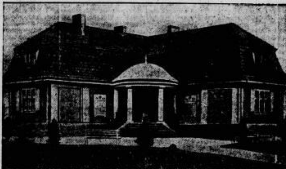
Ein sinnvolles Krieger-Denkmal hat die Stadt Wernuchen ihren gefallenen Söhnen errichtet. An ein Haus, das vier Wohnungen für Kriegsbeschädigte oder Kriegserwitwen enthält, ist ein von Säulen getragener Kuppelbau angefügt, unter dem das eigentliche Denkmal, ein liegender Krieger, seine Aufstellung gefunden hat. Die beiden rechts und links angebrachten Tafeln tragen die Namen der Gefallenen. — Man kann sich gewiß keine sinnvollere Form der Gefallenen-Ehrung denken als die, die gleichzeitig für die invaliden Kameraden der Toten oder ihre Angehörigen sorgt.