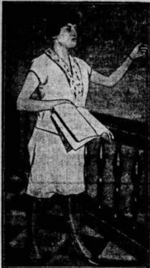
Eine merkwürdige Gerichtsrobe, weiße Sportweste und Knickerbockers, wurde kürzlich von einer Rechtsanwältin bei ihrem Plädoyer vor dem Gericht in Brooklyn (N. S. A. natürlich) getragen, die damit das ungeteilte Vertrauen des ganzen Gerichtshofes erregte. In zehn Jahren werden die amerikanischen Anwältinnen ihre Verteidigungskreden ohne Zweifel im Badeanzug vortragen.