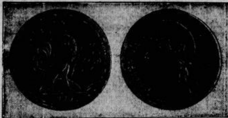
Glückliches Frankreich das in Kürze neue 100-Franc-Stücke in Gold in den Verkehr bringen wird.