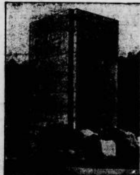
Dem Eroberer von Deutsch-Ostafrika, Dr. Carl Peters, wurde anlässlich der 10. Wiederkehr seines Todestages auf dem Friedhof in Hannover, wo er seine letzte Ruhestätte gefunden hat, ein Denkmal gesetzt, das die Inschriften trägt: „Dr. Carl Peters“ und „Er erwarb Deutsch-Ostafrika für sein Vaterland“.