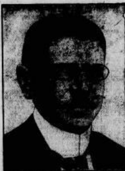
Reichsminister a. D. Dr. Doll vollendet am 23. September sein 60. Lebensjahr. Dr. Doll leitete das Reichswehrministerium, das Reichsjustizministerium und das Ministerium für die besetzten Gebiete. Seit 1912 vertritt er im Reichstags die Zentrumspartei.