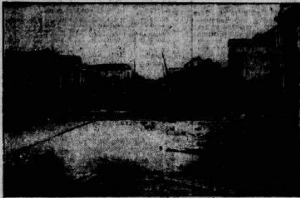
Die Tornadokatastrophe in Belgien scheint sehr viel größeren Umfangs zu sein, als man zuerst geglaubt hatte. Man befürchtet, daß etwa tausend Menschen ums Leben gekommen sind.