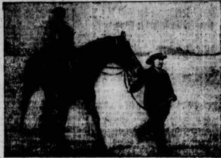
Der Sieger im deutschen Saint Leger, das am 16. September auf der Berliner Grunewald-Rennbahn gelaufen wurde, war der Englische Hengst „Lupus“ unter Haynes.