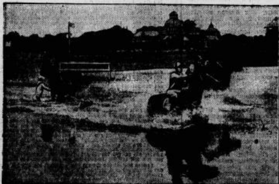
Ein Bad im Karlsruher See. Bei dem am 16. September in Karlsruhe bei Berlin gelaufenen Rennen um den Preußen-Preis wurde zum erstenmal wieder seit Jahren das Feld durch den hierzu angeschauten See geschickt. Hierbei mußte „Hoppelkopfs“ Reiter (links) Bekanntschaft mit dem feuchten Element machen.