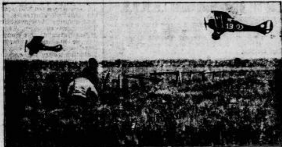
Französische Flugmanöver, an denen etwa 300 Flugzeuge teilnahmen, wurden bei Paris abgehalten. — Im Bilde: Zwei Flugzeuge, die durch die im Vordergrund sichtbaren Maschinengewehre „außer Gefecht“ gesetzt sind, scheiden aus den Luftkämpfen aus und landen.