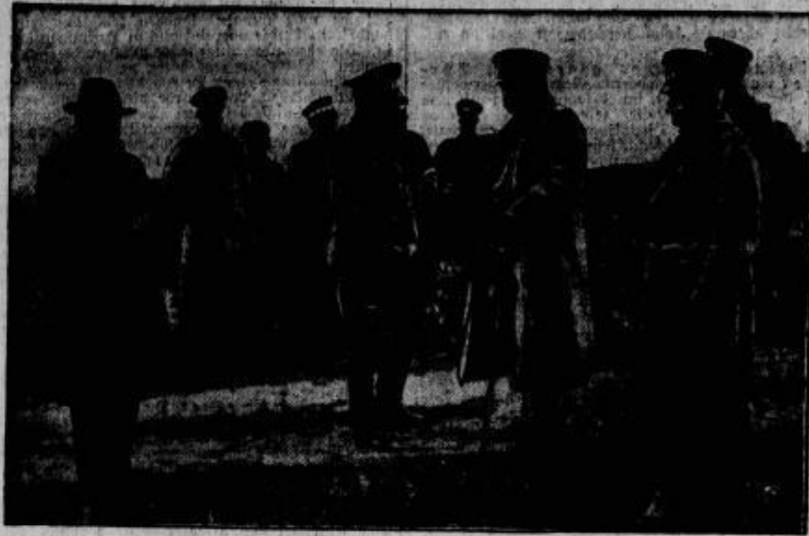
Die Stabenburg-Randvoer in Nieder-Sachsen nehmen in Gegenwart zahlreicher hervor- ragender Teilnehmer ihren Verlauf. Im Bilde: Der Reichs- präsident im Gespräch mit dem früheren Chef der Seeres- leitung, General v. Seede. Rechts der jetzige Chef, General Gene. Links Reichswehrminister Groener.