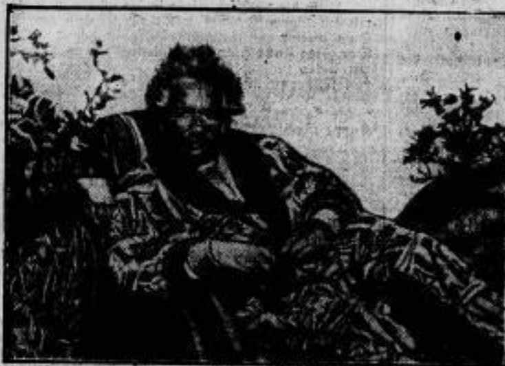
Professor Albert Einstein hat sich von seiner monatelangen schweren Erkrankung in völliger Zurückgezogenheit in einem kleinen Badeort an der Zürcher See soweit erholt, daß er seine Arbeit bald wieder aufnehmen kann.