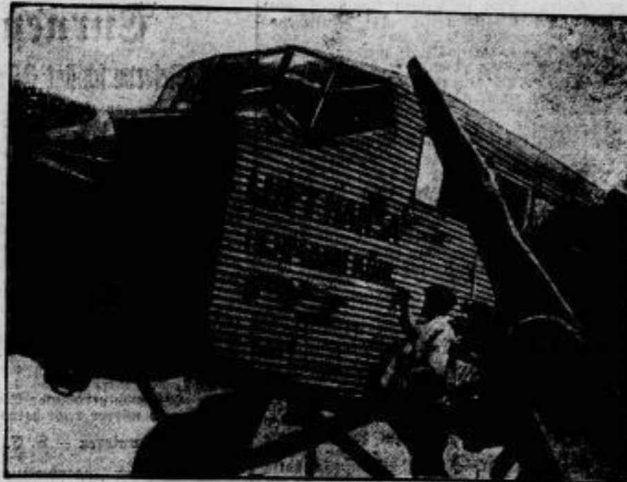
Großflugzeug „Deutschland“ verbrannt. Das Großflugzeug „Deutschland“, eine Schwermaschine des „Germann Röhrl“ (im Bilde), ist am 25. September nach einer Notlandung, die es während des Fluges Paris-Berlin bei Arnberg vornehmen mußte, in Brand geraten und völlig zerstört. Fluggäste und Besatzung konnten sich retten.