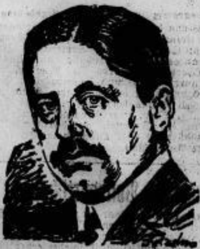
Die Wahlen in Schweden. Als einen starken Aufschwung nach rechts brachten, bedeuten für den libe- ralen Außenminister Löfgren eine persönliche Niederlage und haben ihn daher zum Rücktritt veranlaßt.