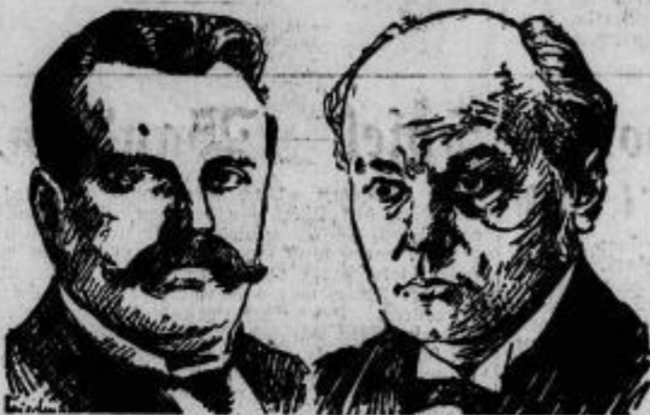
Rücktritt des tschechoslowakischen Ministerpräsidenten. Ministerpräsident Ševčík (rechts), der seit mehreren Mona- ten krank ist, wird in nächster Zeit zurücktreten. Als sein Nachfolger wird der Kriegsminister Udrjal (links) genannt.