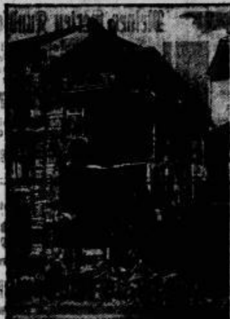
Wohnhausbrand - Gasseinkauf. In Wittenberg (Ehr.) wurden infolge eines Brandes unterhalb der Grundmauern eines Hauses unterirdisch die Folgen der Einsturz des Hauses, der sich als katastrophal durch Sprünge in den Wänden so rechtzeitig ankündigte, daß die Bewohner sich in Sicherheit bringen konnten.