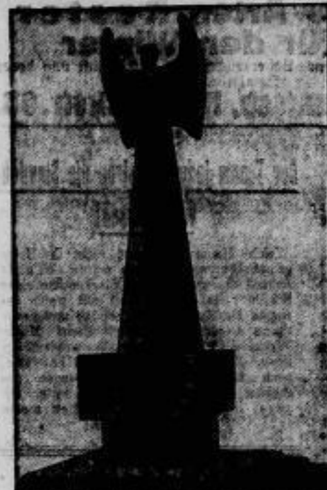
Ein Ehrenmal für Paul Sanner, den im vorigen Jahre in Kopenhagen tödlich verunglückten Hamburger Flieger, wird von dem Hamburger Verein für Luftfahrt auf dem Flugplatz Hamburg-Fuhlsbüttel nach einem Entwurf des Bildhauers Richard Späth errichtet.