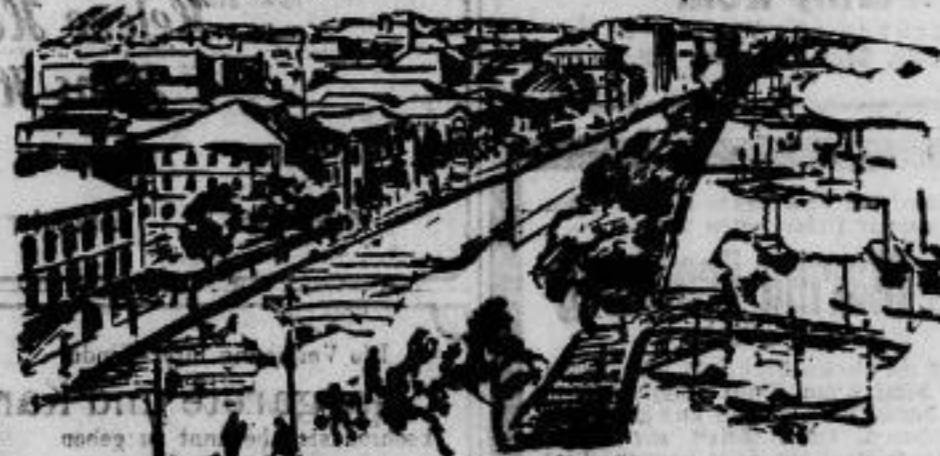
Ein Haus durch Feuer zerstört. In Gansau (Ehr.) brach in einem Spielhause ein Brand aus, der in kurzer Zeit 2000 Käufer einäscherte. Man befürchtet, daß zahlreiche Personen in den Flammen umgekommen sind. — Im Bild: Das Stahlbild von Gansau vom Oesen her gesehen.