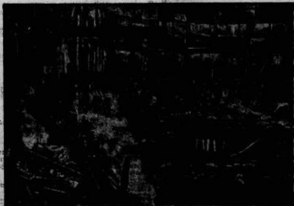
Das Innere des ausgetrockneten „Centro de Recreación“, aus dessen Trümmern weit mehr als hundert Tote geborgen wurden.