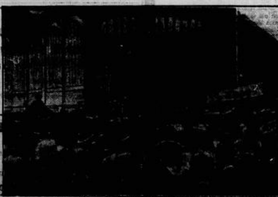
Die Restschmucke drängt sich vor dem vom Feuer verschontem Eingang des Theaters, um Aufbruch über verbleibende Familienangehörige zu erhalten.