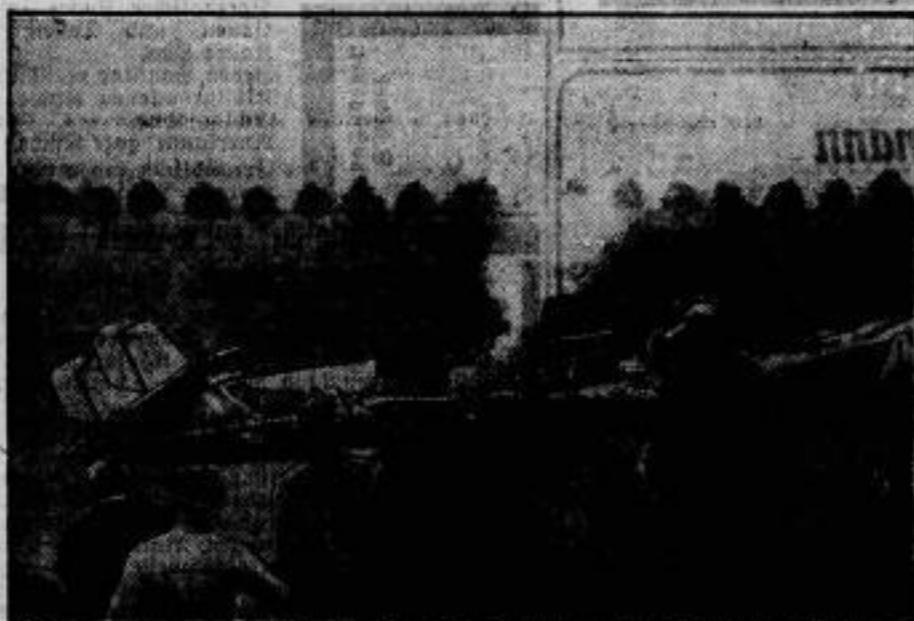
Das verbrannte Großhaus „Deutschland“, das nach seiner Zerstörung bei Krasberg (Ehr.) ein Haus der Glanzen wurde.